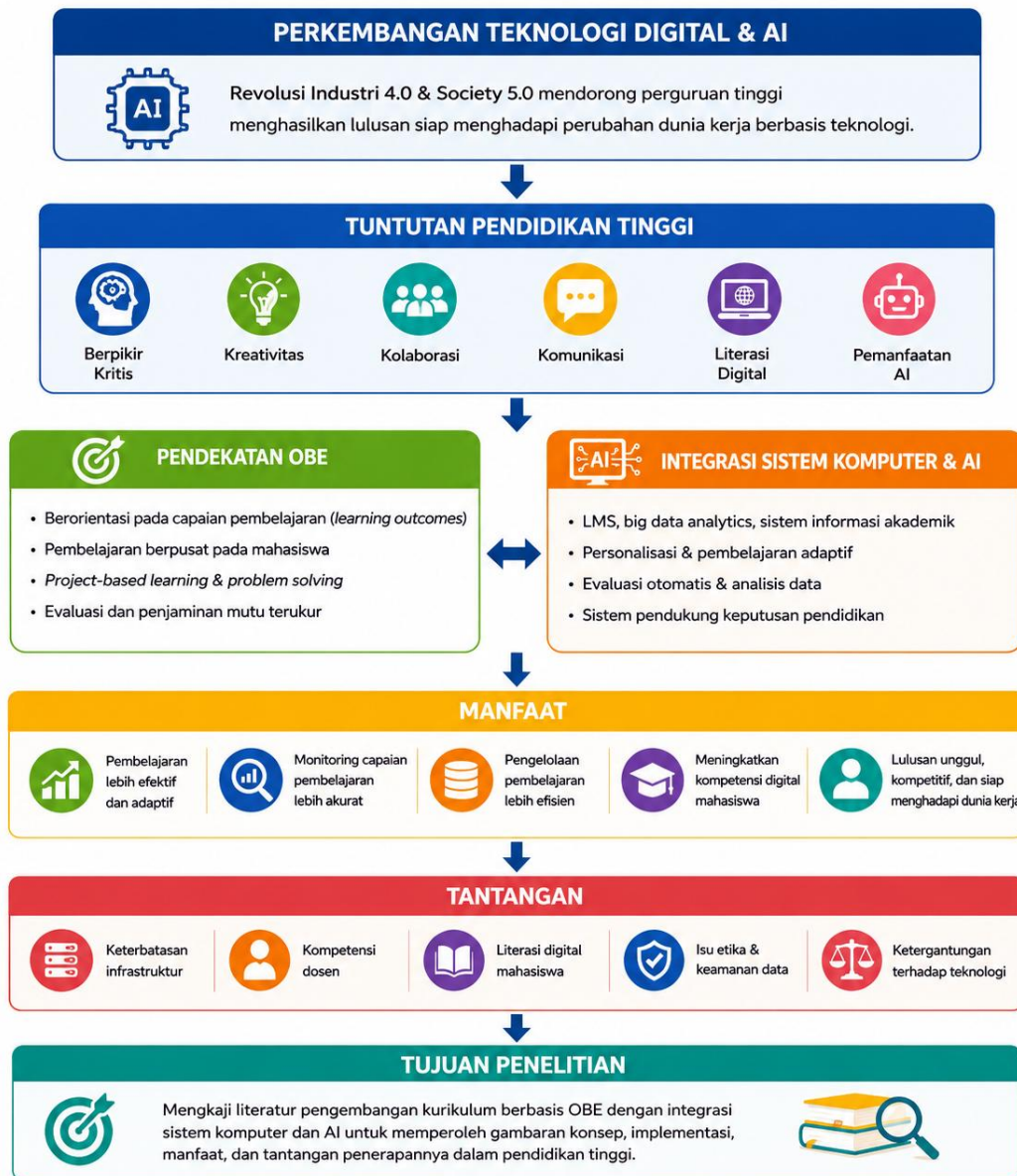
Gambar 1. Perkembangan Teknologi digital dan AI

implementasi, manfaat, dan tantangan penerapannya dalam pendidikan tinggi.[19],[20]