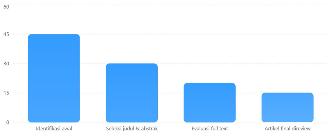
Gambar 2 Diagram PRISMA

Proses seleksi artikel berdasarkan pendekatan PRISMA pada penelitian ini.