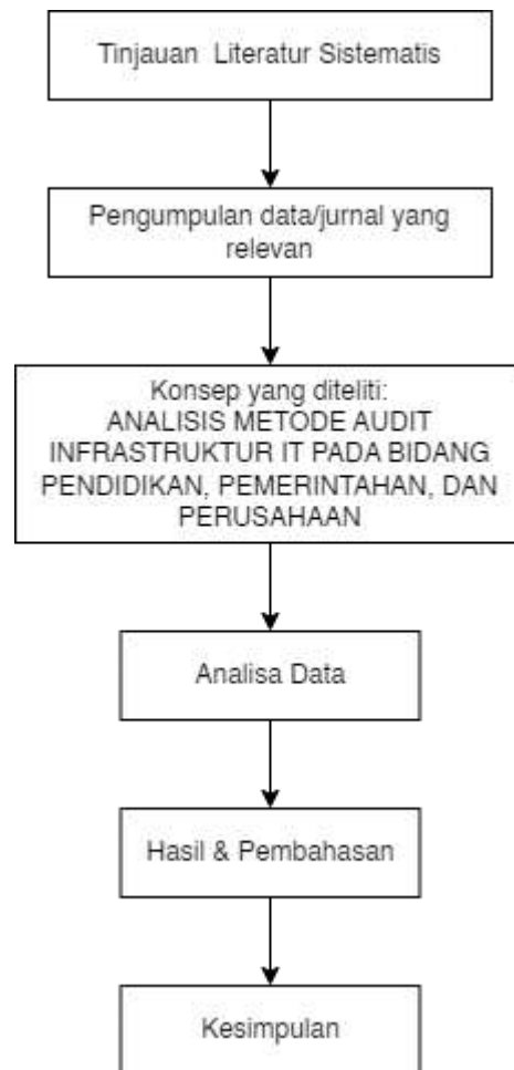
Gambar 1. Bagan Tahapan Penelitian

Berikut ini adalah langkah-langkah dalam menulis penelitian seperti gambar berikut ini: