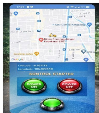
Gambar 3. Layar Peta Aplikasi Android

Aplikasi Android berhasil diimplementasikan dengan interface yang user-friendly. Gambar 2 menunjukkan screenshot aplikasi yang terdiri dari: (1) layar splash screen dengan logo aplikasi, (2) layar login dengan autentikasi Firebase, dan (3) layar utama yang menampilkan peta Google Maps dengan marker real-time, indikator status engine, dan tombol kontrol.