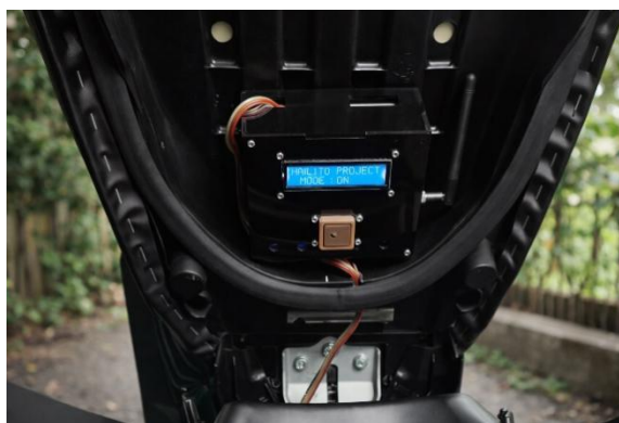
Gambar 2. Pemasangan Sensor GPS

Pemasangan sensor GPS dilakukan pada area di bawah jok dengan pertimbangan: (1) posisi relatif terbuka sehingga memudahkan penerimaan sinyal satelit, (2) terlindung dari cuaca dan debu, dan (3) tidak mudah terdeteksi oleh pihak yang tidak berwenang. Sensor proximity dipasang dengan orientasi yang dapat mendeteksi getaran pada rangka kendaraan. Kabel kontrol dari relay dihubungkan ke sistem starter kendaraan melalui kontak saklar, memungkinkan pemutusan aliran listrik dari jarak jauh.