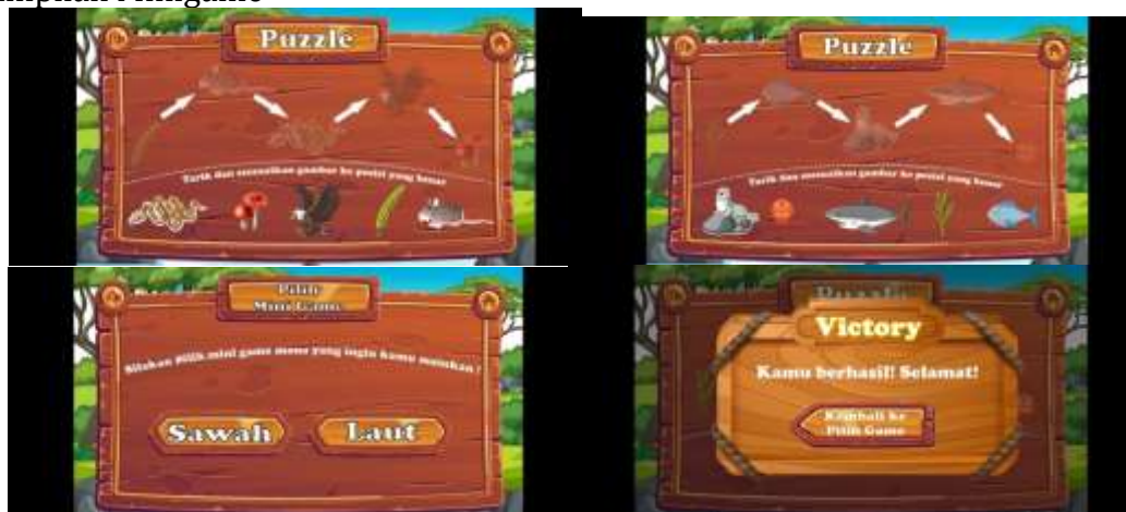
Gambar 6. Tampilan Minigame

Dihalaman ini terdapat pilihan game yaitu sawah atau laut setelah game dimainkan maka akan ada pop up yang muncul memberitahukan bahwa permainan berhasil diselesaikan.