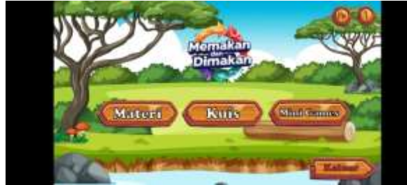
Gambar 3. Halaman Utama

Dihalaman ini terdapat 3 menu yaitu materi, kuis dan minigame . Kemudian terdapat juga tombol keluar.