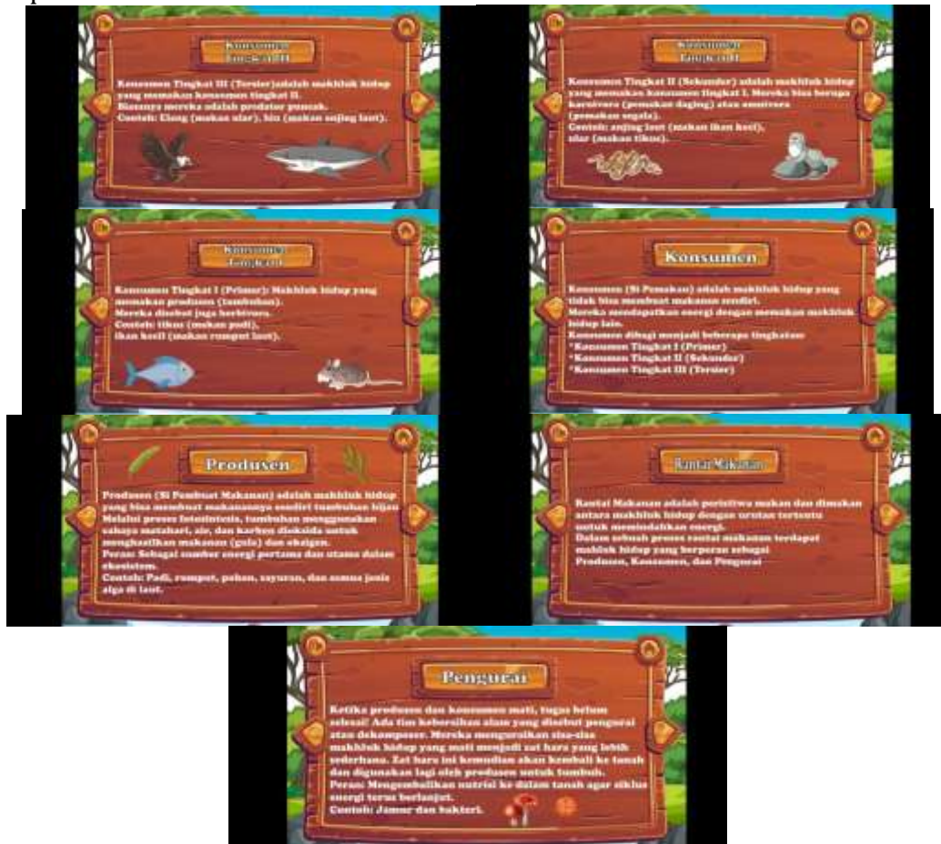
Gambar 4. Tampilan Materi

Dihalaman ini terdapat materi ranai makanan secara urut serta contohnya.