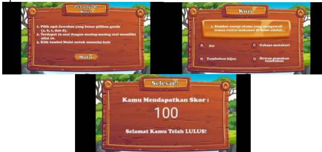
Gambar 5. Tampilan Kuis

Dihalaman ini terdapat panduan mengerjakan kuis, soal kuis dan hasil atau nilai dari jawaban yang telah di pilih.