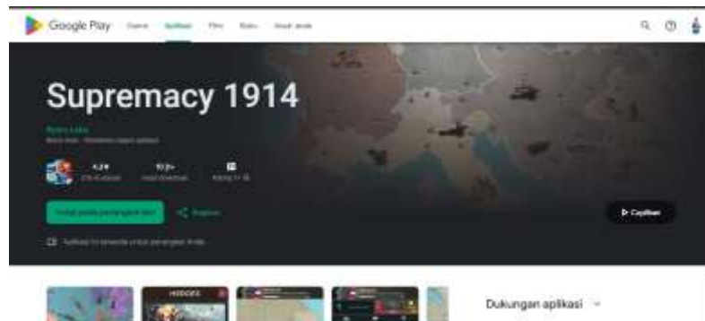
Gambar 2. Sumber data pada komentar

dipelajari dan dapat dijalankan pada berbagai platform dengan fokus utama pada keterbacaan kode[10]. Ulasan yang diambil sebagai data didasarkan pada opini pengguna terkait pengalaman mereka dalam menggunakan game Supremacy 1914. Jumlah data yang dikumpulkan adalah 1000 ulasan, yang mencakup ulasan positif dan negatif, sebagaimana terlihat pada Gambar 2.