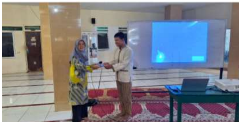
Gambar 5. Pemberian Bingkisan Kepada Siswa

Bagi siswa yang benar menjawab pertanyaan dari tim PkM akan mendapatkan hadiah berupa bingkisan. Hal ini menambah semangat dan motivasi bagi siswa Pesantren Ramadhan dalam memahami materi yang diberikan oleh tim PkM, sehingga nantinya dapat menjawab pertanyaan yang diberikan oleh tim PkM. Kegiatan pemberian hadiah berupa bingkisan dapat dilihat pada Gambar 5.