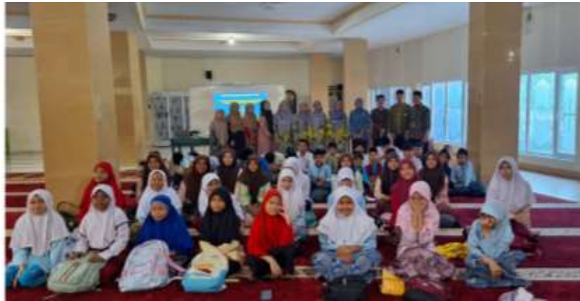
Gambar 6. Foto Bersama Kegiatan PkM

Secara umum, pelaksanaan kegiatan pengabdian kepada masyarakat ini berjalan dengan lancar. Semua siswa terlibat sangat aktif dan antusias selama kegiatan pengabdian berlangsung. Namun, terdapat beberapa kendala yang dihadapi oleh tim PKM selama kegiatan pengabdian ini, yaitu: (1) Pelaksanaan kegiatan tidak bisa dilaksanakan tepat waktu karena ada kendala teknis dalam persiapan perangkat, yaitu infokus dan speaker yang belum terpasang di ruangan tempat pengabdian, (2) Tidak adanya jaringan internet di lokasi pengabdian, sehingga menyulitkan tim dalam memberikan materi kepada siswa, (3) Sebagian siswa yang masih SD maupun yang SMP agak sulit memahami tentang media sosial dan teknologi yang berhubungan dengan internet.