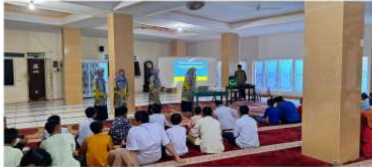
Gambar 4. Sesi Pertanyaan Materi Pemberian Hadiah Kepada Siswa Pesantren Ramadhan

benar oleh siswa. Hal ini membuktikan bahwa para siswa memahami tentang penjelasan materi yang diberikan oleh tim PkM. Kegiatan sesi pertanyaan ini dapat dilihat pada Gambar 4.