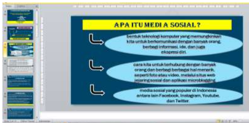
Gambar 1. Materi Tentang Media Sosial