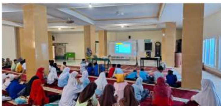
Gambar 3. Materi Perkembangan Teknologi

Selain pelaksanaan sosialisasi tentang penguatan akhlak remaja dalam bermedia sosial dan menghindari tawuran, tim PkM juga meningkatkan pemahaman siswa tentang bagaimana perkembangan teknologi yang semakin cepat berkembang. Dalam kegiatan ini siswa-siswa para peserta Pesantren Ramadhan juga mendapatkan pengetahuan tentang memanfaatkan internet secara positif dan menghindari hal-hal yang negatif. Untuk lebih jelasnya pelaksanaan kegiatan ini dapat dilihat pada Gambar 3 berikut ini.