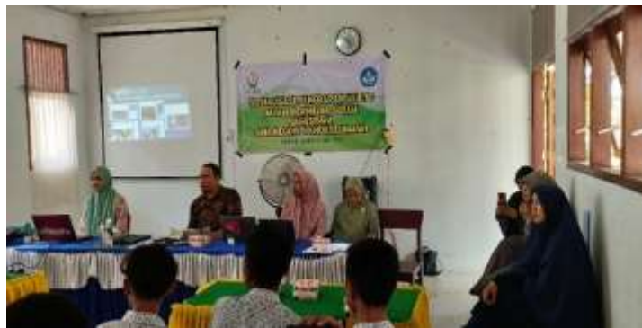
Gambar 2. Kegiatan Sosialisasi UU ITE dan Berita Hoax di SMA Negeri 4 Lhokseumawe

Pada Gambar 2 memperlihatkan tim pelaksana Pengabdian kepada Masyarakat yang terdiri dari 6 dosen dari 3 (tiga) program studi di Universitas Malikussaleh, diantaranya Prodi Sistem Informasi, Prodi Teknik Informatika, dan Prodi Pendidikan Bahasa. Sosialisasi ini dihadiri oleh 32 siswa/siswi dari kelas X dan XI (Gambar 3).