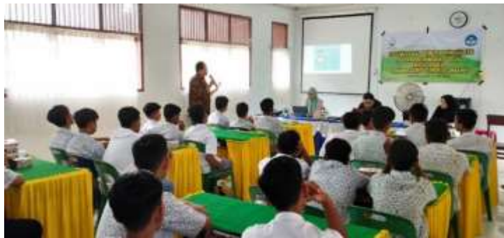
Gambar 4. Penyampaian Materi Berita Hoax Kepada Siswa/Siswi SMA Negeri 4 Lhokseumawe

Selanjutnya, penyampaian materi terkait UU ITE, terutama masalah hukuman/sanksi yang berlaku apabila terbukti melakukan pelanggaran UU ITE (Gambar 5). Tim pelaksana juga memberikan beberapa rekomendasi yang dapat ditempuh oleh siswa/siswi SMA Negeri 4 Lhokseumawe agar dapat menghindari atau meminimalisir penyebaran berita hoax.