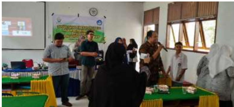
Gambar 7. Pemateri Memberikan Pertanyaan kepada Siswa/siswi

Selain diskusi dan tanya jawab, tim pengabdian juga mengadakan beberapa games yang terkait dengan materi sosialisasi, yaitu berita hoax dan UU ITE. Tujuan dari games ini adalah sebagai ice breaking agar suasana di dalam ruangan tidak membosankan (Gambar 8).