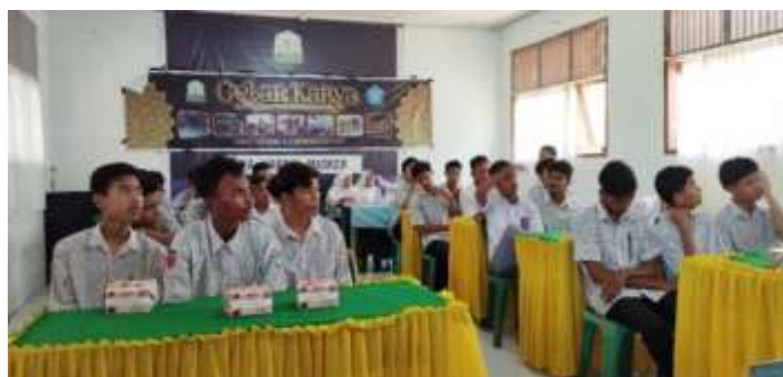
Gambar 3. Siswa/Siswi SMA Negeri 4 Lhokseumawe

Pada Gambar 2 memperlihatkan tim pelaksana Pengabdian kepada Masyarakat yang terdiri dari 6 dosen dari 3 (tiga) program studi di Universitas Malikussaleh, diantaranya Prodi Sistem Informasi, Prodi Teknik Informatika, dan Prodi Pendidikan Bahasa. Sosialisasi ini dihadiri oleh 32 siswa/siswi dari kelas X dan XI (Gambar 3).