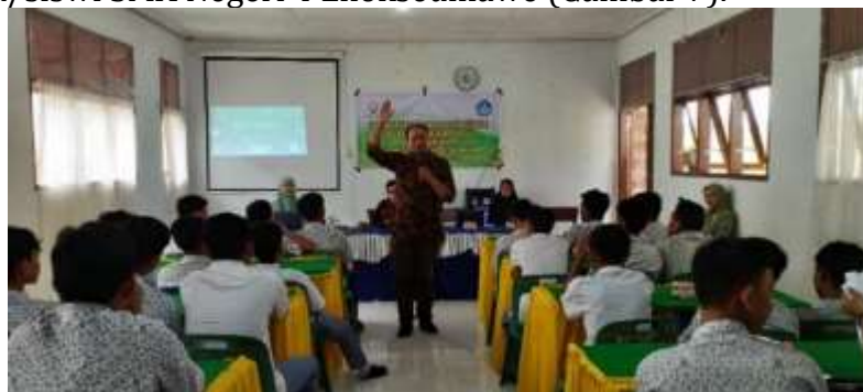
Gambar 6. Diskusi dan Tanya Jawab

Setelah pemaparan materi sosialisasi, kegiatan selanjutnya diisi dengan tanya jawab dan diskusi (Gambar 6). Diskusi berlangsung selama 30 menit, dimana beberapa siswa/siswi turut memberikan pertanyaan maupun saling berbagi pengalaman tentang berita hoax. Kegiatan diskusi ini berlangsung secara komunikatif dan interaktif, sehingga materi sosialisasi yang disampaikan sebelumnya dapat tersampaikan dengan baik bagi siswa/siswi SMA Negeri 4 Lhokseumawe (Gambar 7).