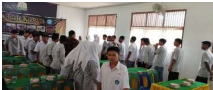
Gambar 8. Suasana Ice Breaking yang Disertai dengan Games Menarik

Selain diskusi dan tanya jawab, tim pengabdian juga mengadakan beberapa games yang terkait dengan materi sosialisasi, yaitu berita hoax dan UU ITE. Tujuan dari games ini adalah sebagai ice breaking agar suasana di dalam ruangan tidak membosankan (Gambar 8).