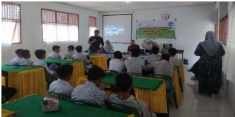
Gambar 5. Penyampaian Materi Berita UU ITE kepada siswa/siswi SMA Negeri 4 Lhokseumawe

Selanjutnya, penyampaian materi terkait UU ITE, terutama masalah hukuman/sanksi yang berlaku apabila terbukti melakukan pelanggaran UU ITE (Gambar 5). Tim pelaksana juga memberikan beberapa rekomendasi yang dapat ditempuh oleh siswa/siswi SMA Negeri 4 Lhokseumawe agar dapat menghindari atau meminimalisir penyebaran berita hoax.