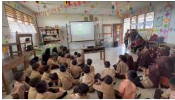
Gambar. 1 Para siswa fokus menonton video