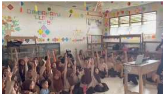
Gambar. 2 Proses tanya jawab dengan para siswa