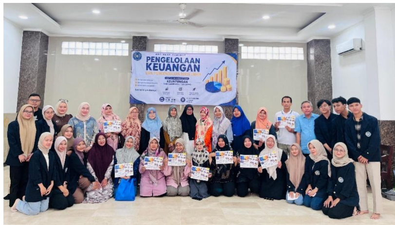
Gambar 4. Foto bersama peserta, narasumber, dan tim penyelenggara PKM FEB UMT

Kegiatan PKM ini menghasilkan beberapa luaran konkret: (1) 25 dokumen rencana bisnis sederhana yang disusun masing-masing mitra sebagai panduan operasional; (2) Modul PKM "Pengelolaan Keuangan dan Pengendalian Biaya untuk UMKM" yang disesuaikan dengan kondisi lokal; (3) komunitas digital mitra UMKM binaan FEB UMT melalui platform pesan instan untuk pendampingan jarak jauh; serta (4) dokumentasi foto dan video sebagai bahan publikasi institusional.