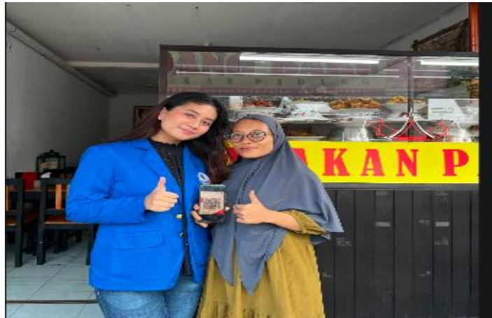
Tabel 2 Hasil Evaluasi Program