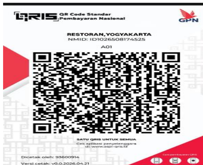
Gambar 2. Tampilan kode QRIS Warung Nasi Padang Gadang Baru