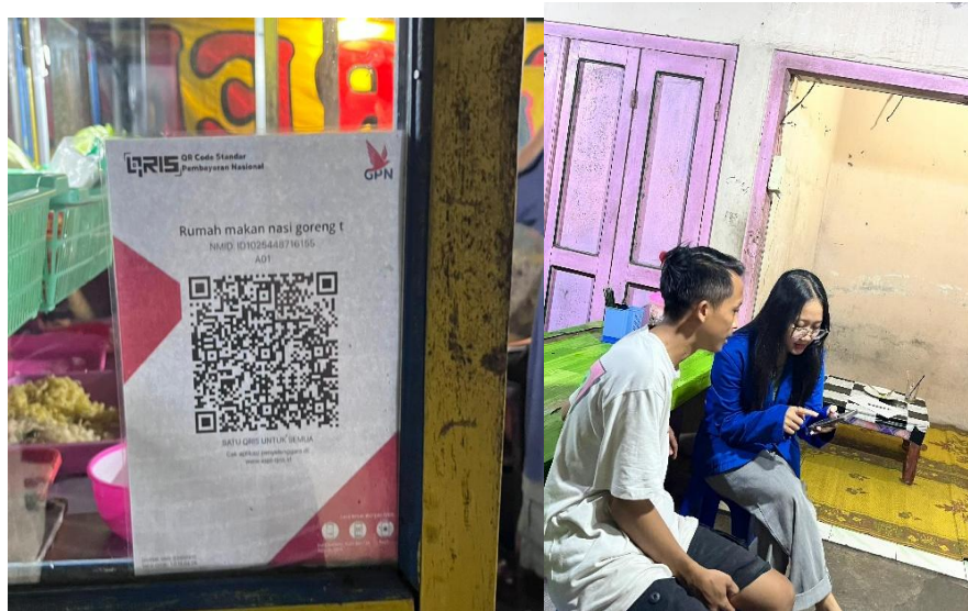
Gambar 3. Pembuatan QRIS