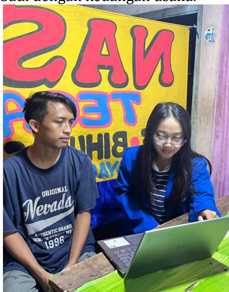
Gambar 2. Pelatihan Pencatatan Keuangan Sederhana

Hasil pre-test menunjukkan bahwa pelaku UMKM belum memahami pentingnya pencatatan keuangan serta belum melakukan pencatatan kas masuk dan kas keluar secara terstruktur. Setelah diberikan pelatihan dan pendampingan, hasil post-test menunjukkan peningkatan pemahaman sebesar 95%. Pelaku UMKM telah mampu melakukan pencatatan kas masuk dan kas keluar serta memahami pentingnya memisahkan keuangan pribadi dengan keuangan usaha.