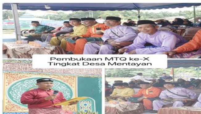
Gambar 4. Pengabdian pendidikan dan keagamaan: pembukaan MTQ Ke-X tingkat Desa Mentayan (2025)

Gambar 4 menampilkan kegiatan pembukaan Musabaqah Tilawatil Qur'an (MTQ) Ke-X tingkat Desa Mentayan sebagai bagian dari pengabdian di bidang pendidikan dan keagamaan. Pada gambar terlihat kehadiran tim KKM dalam kegiatan resmi desa bersama aparat pemerintah desa, tokoh masyarakat, dan warga. Kegiatan MTQ berfungsi sebagai wadah pemuda dan warga dalam memperkuat nilai keagamaan, kebersamaan, dan partisipasi publik, sejalan dengan visi Pemerintah Desa Mentayan yang agamis, mandiri, dan berbudaya. Partisipasi mahasiswa mempertegas dimensi Tridharma perguruan tinggi, khususnya transfer nilai dan penguatan hubungan kampus-masyarakat. Gambar ini melengkapi hasil kegiatan inti pada aspek sosiobudaya dan partisipasi sosial pada Tabel 4, serta tahap pelaksanaan dalam Tabel 2, sehingga KKM tidak hanya berfokus pada sektor ekonomi, melainkan juga mendukung pembangunan karakter dan kohesi sosial masyarakat desa.