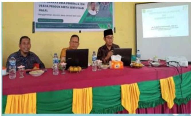
Gambar 2. Seminar dan praktik perekonomian kreatif di Desa Mentayan (2025)

menjadi pintu masuk pemahaman masyarakat bahwa hasil pertanian memiliki nilai tambah di luar beras dan bahwa inovasi produk dapat menjadi penopang pendapatan sampingan di tengah kesibukan bertani. Materi agrowisata yang disampaikan dalam seminar ini mendukung poin ketiga hasil kegiatan inti tentang potensi mangrove dan sektor pertanian sebagai basis usaha. Capaian kegiatan terkait aspek kreativitas dan ekonomi kreatif pada Tabel 4, serta tahap pelaksanaan dalam Tabel 2.