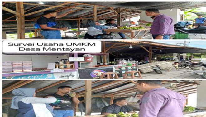
Gambar 3. Pendampingan pengelolaan usaha dan pemasaran UMKM di Desa Mentayan (2025)

Gambar 4 menampilkan kegiatan pembukaan Musabaqah Tilawatil Qur'an (MTQ) Ke-X tingkat Desa Mentayan sebagai bagian dari pengabdian di bidang pendidikan dan keagamaan. Pada gambar terlihat kehadiran tim KKM dalam kegiatan resmi desa bersama aparat pemerintah desa, tokoh masyarakat, dan warga. Kegiatan MTQ berfungsi sebagai wadah pemuda dan warga dalam memperkuat nilai keagamaan, kebersamaan, dan partisipasi publik, sejalan dengan visi Pemerintah Desa Mentayan yang agamis, mandiri, dan berbudaya. Partisipasi mahasiswa mempertegas dimensi Tridharma perguruan tinggi, khususnya transfer nilai dan penguatan hubungan kampus-masyarakat. Gambar ini melengkapi hasil kegiatan inti pada aspek sosiobudaya dan partisipasi sosial pada Tabel 4, serta tahap pelaksanaan dalam Tabel 2, sehingga KKM tidak hanya berfokus pada sektor ekonomi, melainkan juga mendukung pembangunan karakter dan kohesi sosial masyarakat desa.