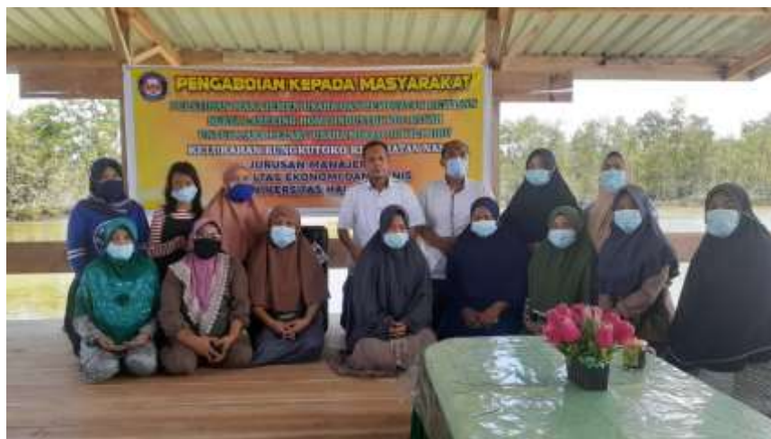
Gambar. 1. Peserta dan Narasumber Kegiatan PkM