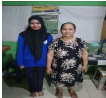
Gambar 2. Observasi

Dari hasil wawancara, pemilik usaha mengungkapkan bahwa pencatatan manual sering menimbulkan kendala dalam memproses data penjualan yang lengkap, merangkum aktivitas transaksi setiap hari, dan sering terciptanya kesalahan saat menghitung uang tunai di akhir hari (Khairiyah dkk., t.t., 2025). Ia juga menambahkan bahwa transaksi tunai meningkatkan risiko uang tercampur dengan kepentingan pribadi, sehingga memisahkan laporan keuangan menjadi lebih sulit. Temuan ini menunjukkan bahwa sebelum kegiatan pengabdian dilakukan, UMKM belum memiliki sistem pencatatan keuangan yang efektif.