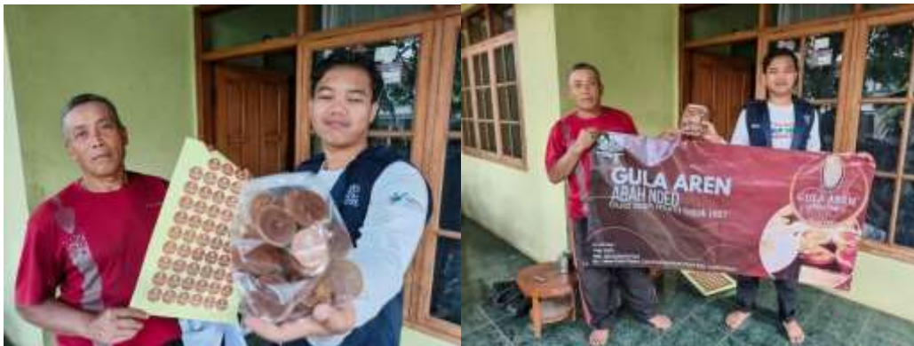
Gamabr 6. Fasilitasi legalitas

Tim KKN-PM Universitas Cipasung melakukan pendampingan kepada pelaku UMKM di Desa Ciawi terkait Sertifikat NIB dan Halal.