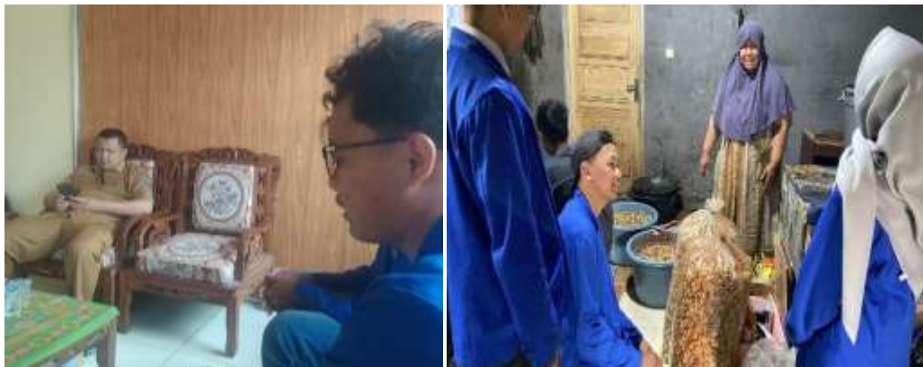
Gambar 2. Koordinasi dengan Kepala Desa dan UMKM

Setelah observasi dilakukan didapatkan data dari beberapa UMKM dari berbagai bidang usaha seperti kuliner, dimana UMKM tersebut berpotensi untuk menjadi sasaran kegiatan. Untuk selanjutnya dilakukan penyebaran undangan dan formulir data untuk para pelaku UMKM melalui kantor Desa Ciawi. Sosialisasi dilakukan melalui pertemuan langsung dengan masyarakat dan pelaku UMKM Desa Ciawi secara gebyar dalam acara Gebyar Legalitas UMKM Desa Ciawi. Peserta yang hadir adalah para pelaku UMKM yang telah mendapat undangan dan formulir. Mengingat hari pelaksanaan acara adalah hari kerja, para pelaku UMKM yang datang melebihi ekspektasi dan mendekati target peserta yaitu 50 pelaku UMKM. Antusiasme para pelaku UMKM Desa Ciawi masih tetap ada bahkan setelah acara Gebyar Legalitas UMKM dilaksanakan, dan pelayanan masih dapat diberikan. Sosialisasi ini juga dibantu oleh pihak LP3H Galunggung, sebagai Lembaga pendamping yang membantu pembuatan legalitas usaha secara gratis.