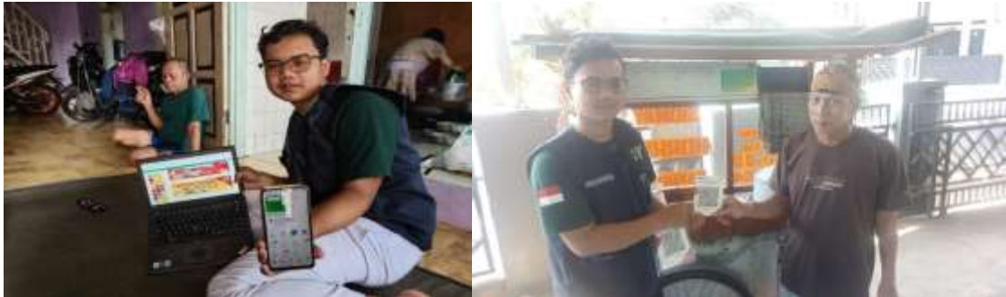
Gamabr 5. Fasilitasi legalitas

ini menjadi dasar dalam pemetaan permasalahan UMKM sebelum program pendampingan dilaksanakan. Kegiatan sosialisasi program KKN-PM Universitas Cipasung di Desa Ciawi berlangsung dengan antusiasme tinggi dari para pelaku UMKM dan masyarakat. Dalam kegiatan ini, tim KKN-PM bersama peserta berdiskusi mengenai penguatan legalitas usaha dan strategi pemasaran digital. Foto tersebut menggambarkan momen kebersamaan seluruh peserta dan tim sebagai simbol kolaborasi dalam mendukung pengembangan UMKM desa.