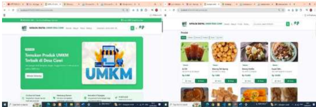
Gambar 7. Website Katalog Digital UMKM Desa Ciawi

Tim KKN-PM Universitas Cipasung melakukan pendampingan pembuatan website Katalog Digital UMKM Desa Ciawi yang bisa di akses seluruh warga Desa Ciawi. Hasil kegiatan KKN ini menunjukkan bahwa pelaku UMKM Desa Ciawi memiliki potensi yang besar, namun sebagian masih menghadapi kendala pada aspek legalitas usaha dan pemasaran digital. Kondisi ini sejalan dengan temuan Soimah et al. (n.d.) yang menegaskan bahwa legalitas usaha merupakan unsur krusial dalam memperkuat pondasi UMKM, baik dari segi pengakuan hukum maupun akses permodalan. Kegiatan sosialisasi dan pelayanan yang dilakukan berhasil meningkatkan pemahaman pelaku UMKM tentang pentingnya memiliki dokumen legalitas seperti NIB dan sertifikasi halal.