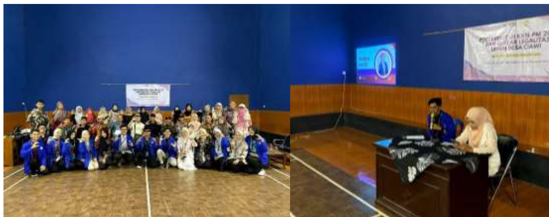
Gambar 3. Pelaksanaan Sosialisasi Legalitas

Setelah observasi dilakukan didapatkan data dari beberapa UMKM dari berbagai bidang usaha seperti kuliner, dimana UMKM tersebut berpotensi untuk menjadi sasaran kegiatan. Untuk selanjutnya dilakukan penyebaran undangan dan formulir data untuk para pelaku UMKM melalui kantor Desa Ciawi. Sosialisasi dilakukan melalui pertemuan langsung dengan masyarakat dan pelaku UMKM Desa Ciawi secara gebyar dalam acara Gebyar Legalitas UMKM Desa Ciawi. Peserta yang hadir adalah para pelaku UMKM yang telah mendapat undangan dan formulir. Mengingat hari pelaksanaan acara adalah hari kerja, para pelaku UMKM yang datang melebihi ekspektasi dan mendekati target peserta yaitu 50 pelaku UMKM. Antusiasme para pelaku UMKM Desa Ciawi masih tetap ada bahkan setelah acara Gebyar Legalitas UMKM dilaksanakan, dan pelayanan masih dapat diberikan. Sosialisasi ini juga dibantu oleh pihak LP3H Galunggung, sebagai Lembaga pendamping yang membantu pembuatan legalitas usaha secara gratis.