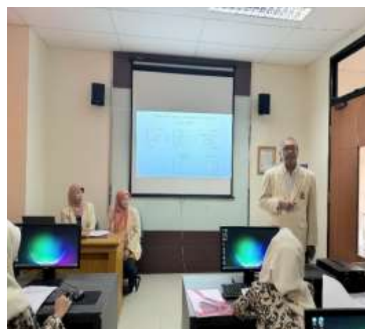
Gambar 3. Pemaparan Materi

Setelah pemaparan materi berikutnya dibuka sesi tanya jawab ( Gambar 4) dimana para peserta dapat bertanya kepada tim Pengabdian Masyarakat tentang laporan keuangan. Dibuka juga kesempatan untuk berdiskusi bagi pelaku peserta untuk