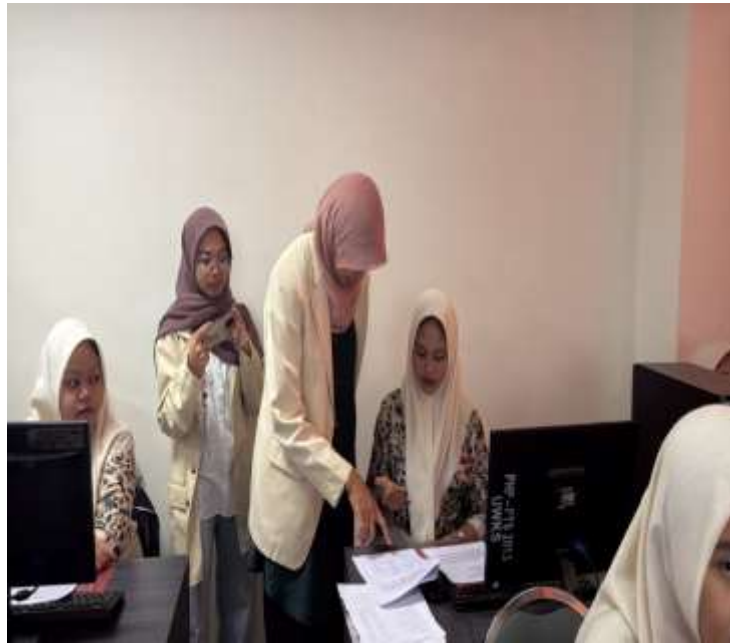
Gambar 4. Sesi Tanya Jawab

berdiskusi terkait dengan penyusunan laporan keuangan sederhana. Dari sini akan terlihat pemahaman siswa mengenai laporan keuangan sederhana sesuai dengan Standar Akuntansi Keuangan. Sesi berikutnya adalah sesi penutupan. Pada sesi ini tim pengabdian dan seluruh peserta melakukan foto Bersama ( Gambar 5).