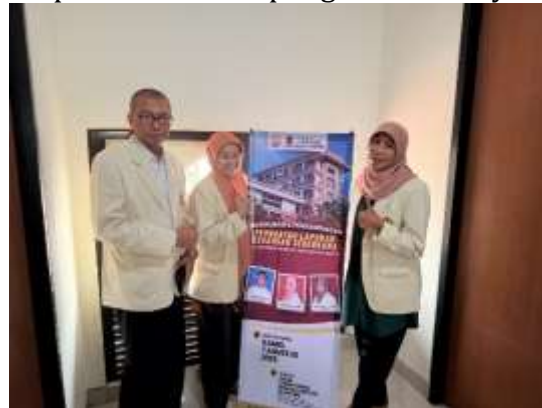
Gambar 2. Tim Pengabdian Masyarakat

Sesi pertama dilakukan pengenalan tim pengabdian masyarakat dengan peserta.