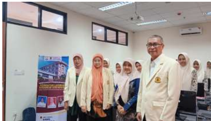
Gambar 5. Foto Bersama Pemateri dan Peserta

Kegiatan Pengabdian Kepada Masyarakat ini telah memberikan hasil yang baik yaitu :