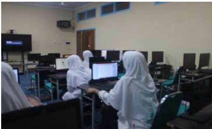
Gambar 4. Cara mengrefrest dan mematikan computer

Pada Gambar 3 terlihat peserta sedang melakukan aktivitas mengisi data diri dalam aplikasi serta mempraktikkan cara menyimpan (save) file program yang telah dibuat di NetBeans IDE. Tahapan ini penting untuk membiasakan peserta dengan manajemen proyek dan pengelolaan file dalam lingkungan pengembangan perangkat lunak. Proses pengisian data diri juga menjadi bagian dari latihan aplikasi praktis yang mengajarkan siswa mengenai interaksi input-output dalam pemrograman Java, sekaligus memperkenalkan konsep penyimpanan file dengan benar agar pekerjaan yang telah dibuat tidak hilang dan dapat diakses kembali untuk pengembangan selanjutnya. Melalui pendampingan pemateri, peserta diajarkan langkah-langkah menyimpan file proyek dengan benar dan penggunaan fitur save yang tersedia di NetBeans, sehingga membentuk kebiasaan baik dalam pengelolaan kode program. Aktivitas ini juga membantu mengasah keterampilan teknis dasar yang sangat dibutuhkan dalam pengembangan perangkat lunak profesional.