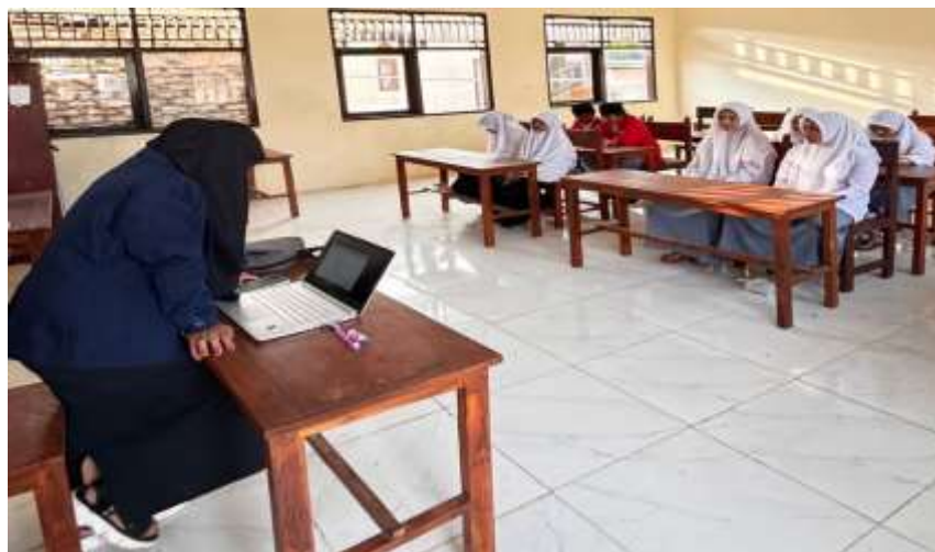
Gambar 1. Peserta focus mendengarkan pemateri yang telah menyampaikan

Setelah semua informasi telah diisi dan konfigurasi selesai dilakukan, langkah selanjutnya adalah mengklik tombol Finish untuk menyelesaikan proses pembuatan proyek. Berikut ini adalah tampilan awal dari proyek yang telah berhasil dibuat: