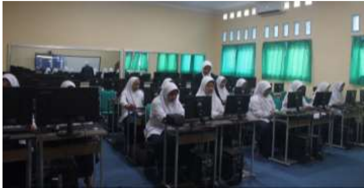
Gambar 3. Mengisi data diri dan cara mengesave file.

yang memudahkan penulisan, debugging, dan menjalankan program Java secara efisien. Keberhasilan peserta dalam mengeksekusi program "Hello World" menjadi tolok ukur awal ketercapaian pembelajaran dan membangun rasa percaya diri untuk melanjutkan ke materi yang lebih kompleks. Metode pembelajaran yang menggabungkan teori dan praktik langsung terbukti efektif dalam meningkatkan pemahaman konsep dasar pemrograman di kalangan siswa SMA.