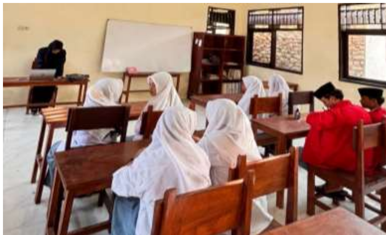
Gambar 2. Menulis dan menjalankan program pertama (Hello World)

Kegiatan pelatihan dilakukan selama tiga sesi utama, dengan materi yang diawali dari pengenalan antarmuka NetBeans, penjelasan fitur-fitur dasar seperti toolbar, menu, dan area kerja. Selanjutnya, peserta diajarkan cara mengetik dan memformat teks program dengan benar, yang kemudian dilanjutkan dengan praktik menjalankan program sederhana. Hasil evaluasi menunjukkan bahwa sekitar 80% peserta mampu memahami konsep dasar penggunaan NetBeans dan pemrograman Java, serta sekitar 60% peserta menunjukkan peningkatan keterampilan dalam membuat dan menjalankan program secara mandiri. NetBeans sebagai IDE terbukti memberikan kemudahan dalam penulisan, pengujian, dan debugging kode Java, dengan fitur lengkap seperti editor kode, debugger, compiler, dan GUI builder. Dalam proses pembelajaran, metode main() sebagai titik awal program selalu menjadi fokus utama, karena merupakan dasar agar program dapat dijalankan di Java. Praktikum yang didampingi oleh pemateri memungkinkan peserta untuk langsung mempraktikkan materi, disertai sesi tanya jawab untuk mengatasi kesulitan yang muncul. Dari gambar terlihat bahwa pemateri aktif memandu peserta secara langsung dengan menggunakan laptop, memberikan penjelasan sambil mendemonstrasikan langkah-langkah di NetBeans. Pendekatan seperti ini efektif untuk memperkuat pemahaman peserta karena mereka dapat langsung mengamati dan mengikuti instruksi secara real time.