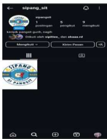
Gambar. 8 Design Media Promosi

Sesuai dengan kondisi UMKM masyarakat sebelumnya khususnya di Desa Sukamaju, banyak yang menjual produk tanpa membuat Logo produk, hal ini terjadi karena berbagai alasan, utamanya karena ketidak tahuan dan karena kekurangan modal. Proses Sosialisasi kepada Pemilik UMKM diharapkan dapat : 1). Memastikan pemahaman brand, 2). Mengoptimalkan Strategi Pemasaran, 3). Meningkatkan Kepedulian terhadap Kualitas Produk, 4). Membekali pemilik UMKM dengan pengetahuan branding, 5). Meningkatkan daya saing melalui kepuasan konsumen. Sosialisasi ini memungkinkan juga pemilik UMKM untuk lebih memahami nilai strategis logo dan kemasan sebagai alat pemasaran dan branding yang penting, sehingga UMKM mampu lebih efektif dalam memperkuat daya saing produk di pasar.