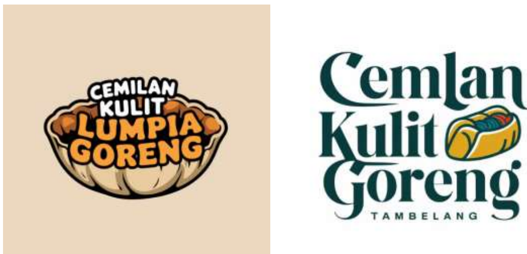
Gambar. 4 Hasil Latihan Pembuatan logo UMKM oleh PKK

Berdasarkan hasil ini, dapat disimpulkan bahwa program penguatan kapasitas SDM dan ekosistem kreatif memberikan dampak positif dalam meningkatkan produktivitas desa. Meskipun tantangan masih ada, strategi yang berkelanjutan dan kolaboratif dapat menjadi solusi bagi desa-desa di Kecamatan Tambelang untuk memperkuat daya saing mereka dalam jangka panjang.