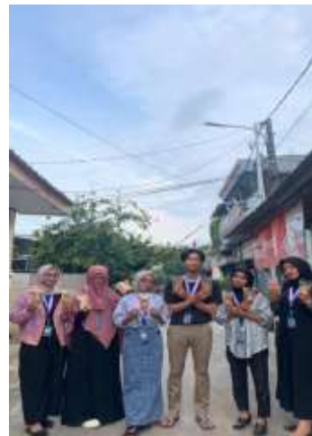
Gambar. 7 Proses Sosialisasi kepada pemilik UMKM