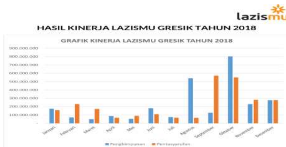
Grafik 1. Data kinerja Tahun 2018

Berdasarkan SURAT KEPUTUSAN (SK) Badan Pengurus LAZISMU Wilayah Jawa Timur, nomor : 030 / KEP / II.17 / D / 2017, tanggal : 30 Muharram 1439 H / 20 Oktober 2017 M. Pada tahun 2010 Pimpinan Daerah Muhammadiyah Kabupaten Gresik membentuk LAZIS Muhammadiyah yang bergerak di wilayah Kabupaten Gresik melalui SK No. 89/2010 Tanggal 24 Juli 2010, dalam penggalangan dan ( fundraising ) melalui team yang dibebankan oleh Cabang Lazismu Gresik, masih belum optimal dengan metode tradisional atau konvensional datang ke donatur atau muzakki untuk mengambil sumbangan atau sedekah, sehingga kurang maksimal dari target yang diberikan terlihat masih belum tercapai seperti dalam tabel dan grafik dibawah ini. Pada tahun 2021-2023