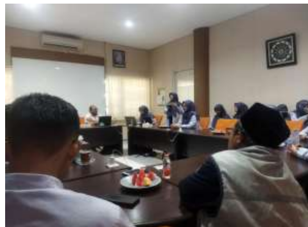
Team relawan administrasi berdiskusi