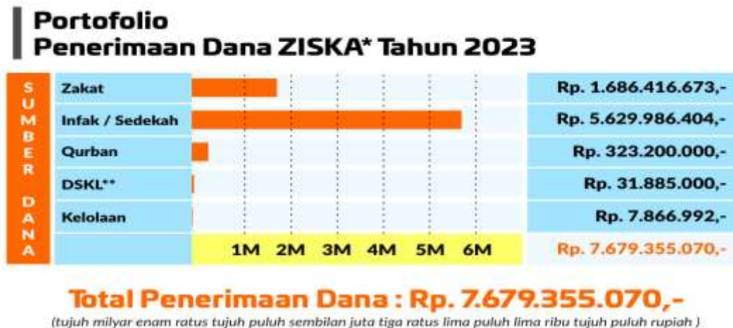
Tabel 4. Data Kinerja Tahun 2022

Sumber : Administrasi Lazismu PDM Gresik