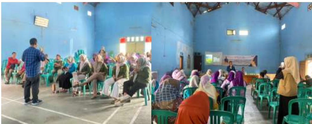
Gambar. 2 Proses tanya jawab materi

Dengan demikian, kegiatan pengabdian masyarakat ini tidak hanya memberikan manfaat langsung bagi koperasi, tetapi juga membuka jalan untuk pengembangan yang lebih berkelanjutan di masa depan.