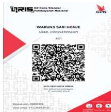
Gambar 3. Hasil Pendaftaran QRIS

Dari hasil pengabdian yang telah dilakukan memberikan banyak manfaat kepada pelaku UMKM diantaranya yaitu, UMKM kini lebih memahami pentingnya pencatatan keuangan yang baik dan benar, mampu membedakan pentingnya antara uang pribadi dan uang usaha, serta memahami konsep dasar pencatatan keuangan secara efektif dan efisien. Dengan menggunakan sistem pencatatan keuangan yang lebih baik dapat memudahkan UMKM dalam mengelola keuangan dan membuat keputusan bisnis, dengan demikian UMKM dapat terus bertahan dan mengembangkan usahanya. Penggunaan QRIS juga memberikan manfaat bagi UMKM dan konsumennya yaitu memudahkan dalam bertransaksi baik secara online maupun offline, sehingga menghemat waktu dan meminimalisir biaya berlebih. Kegiatan pengabdian masyarakat ini berhasil meningkatkan kapasitas UMKM dalam mengelola pencatatan keuangan, memperluas akses pasar dan meningkatkan efisiensi transaksi. Hal ini pada akhirnya berkontribusi pada pemberdayaan UMKM, meningkatkan perekonomian masyarakat dan dapat juga mengembangkan inklusi keuangan di daerah tersebut