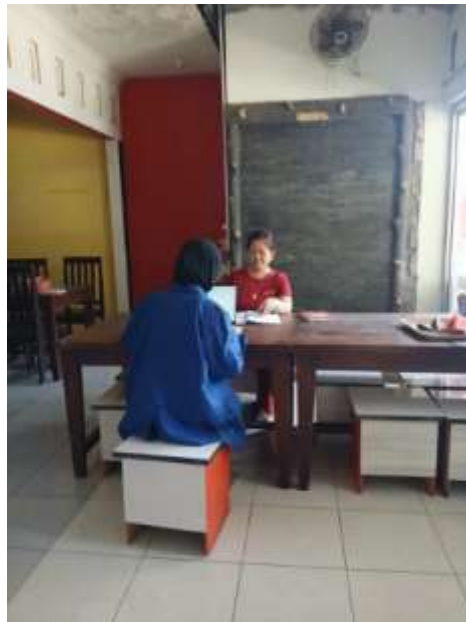
Gambar 2. Pelatihan Pencatatan Keuangan

Selain pencatatan keuangan, kegiatan ini juga memperkenalkan penggunaan QRIS sebagai metode pembayaran digital yang lebih praktis dan efisien. Proses pendaftaran QRIS dibantu secara langsung oleh tim pengabdian agar UMKM dapat segera memanfaatkan layanan tersebut. Simulasi transaksi menggunakan QRIS dilakukan untuk memastikan pelaku usaha memahami cara menggunakannya dalam operasional bisnis sehari-hari. Hasil implementasi menunjukkan bahwa setelah penggunaan QRIS, UMKM mengalami peningkatan transaksi non-tunai, yang berkontribusi pada peningkatan kenyamanan pelanggan serta efisiensi dalam pengelolaan keuangan.