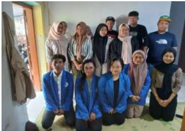
Gambar. 1 dokumentasi Kegiatan

Kegiatan ini memberikan dampak positif dalam meningkatkan kesadaran pajak di kalangan pemuda Desa Karanglo dan diharapkan dapat memberikan kontribusi besar dalam meningkatkan kepatuhan pajak di masa depan.