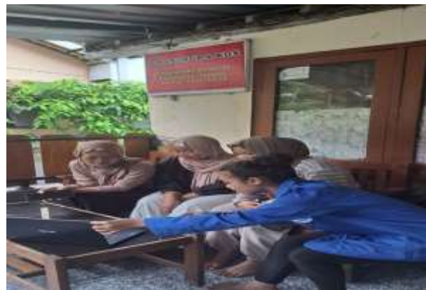
Gambar. 3 Proses evaluasi