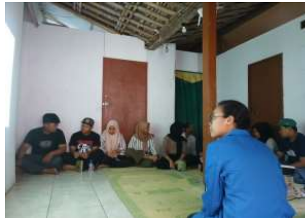
Gambar. 3 Sosialisasi Kegiatan