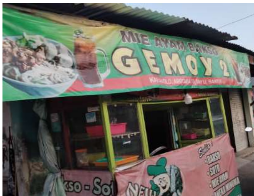
Gambar 2. Lokasi Usaha

Kegiatan pengabdian masyarakat ini dilaksanakan selama satu bulan mengikuti jadwal yang telah direncanakan. Tahapan awal kegiatan dimulai dengan survey melalui kunjungan langsung ke lokasi usaha serta melakukan wawancara dengan mitra UMKM. Dari survey tersebut, diperoleh informasi penting bahwa pelaku usaha belum memiliki pemahaman yang memadai mengenai pencatatan keuangan maupun penyusunan laporan keuangan. Selain itu, ditemukan bahwa UMKM mie ayam yang berada di dekat sekolah cenderung hanya mengandalkan siswa-siswi sebagai pelanggan utama yang mampir ke warung mereka tanpa strategi pemasaran yang lebih luas.