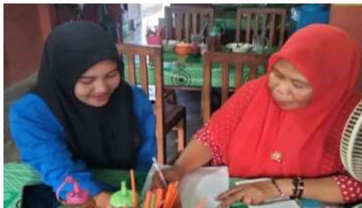
Gambar 3. Pelatihan membuat laporan keuangan sederhana

Basompe (2023) menjelaskan bahwa mengelola bisnis baik dalam skala kecil maupun skala besar hal yang terpenting adalah adanya pencatatan laporan keuangan yang baik. Karena hal ini merupakan bagian terpenting dalam suatu bisnis. Hal ini terjadi pada UMKM, dalam pencatatan laporan keuangan masih banyak yang merasa kesulitan dalam melakukan pencatatan laporan keuangan. Padahal, pelaku UMKM bisa menggunakan laporan keuangan sederhana yang mudah untuk dilakukan. Edukasi atau pelatihan terhadap UMKM ini sangat penting untuk dilakukan agar pelaku UMKM mengetahui tentang perkembangan usahanya. Berikut disajikan beberapa dokumentasi kegiatan pelatihan bagi UMKM (Gambar 3).