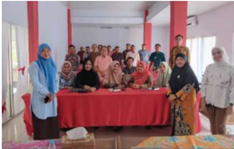
Gambar 2. Peserta dalam Workshop Telaah Laporan Keuangan Koperasi

Kegiatan pelatihan dapat meningkatkan keterampilan baru kepada pengurus dan anggota, yang penting untuk mengembangkan pribadi dan profesional. Disamping itu juga dapat Membangun Tim yang Solid. Pelatihan juga dapat memperkuat kerjasama dan komunikasi antar anggota, menciptakan tim yang lebih solid. Peningkatan Akses ke Pembiayaan Kemampuan Mengajukan Proposal: Pengurus yang terlatih dapat menyusun proposal keuangan yang lebih baik untuk mendapatkan pembiayaan dari lembaga keuangan. Dengan pengelolaan keuangan yang baik, koperasi dapat lebih menarik bagi investor dan donatur. Dengan pengelolaan keuangan yang efektif, koperasi dapat meningkatkan pendapatan, yang pada gilirannya akan meningkatkan kesejahteraan anggota. Koperasi yang sehat secara finansial dapat menjalankan program-program sosial yang bermanfaat bagi anggota.