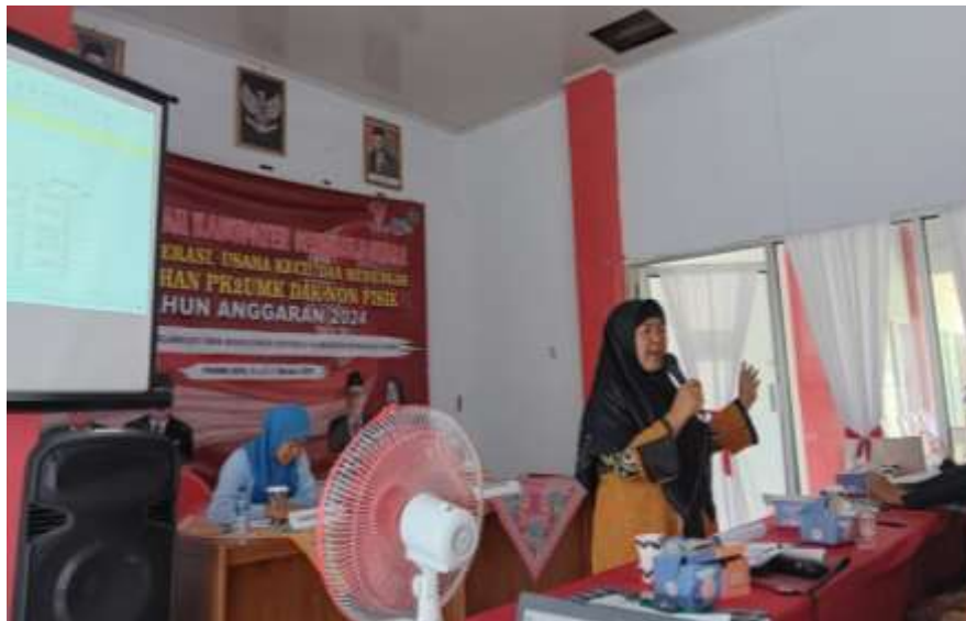
Gambar 2. Peningkatan Keterampilan Pengurus Koperasi Melalui Pelatihan Manajemen Keuangan untuk Meningkatkan Kesejahteraan Anggota dan Keberlanjutan Koperasi