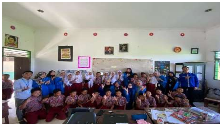
Gambar 5. Para tim melakukan sesi foto Bersama siswa/i SDN 106192

Gambar 5 menunjukkan tim yang melakukan sesi foto bersama siswa/i SDN 106192 setelah menyelesaikan kegiatan edukasi. Momen ini bukan hanya sebagai bentuk dokumentasi, tetapi juga simbol kebersamaan dan kesuksesan dari program yang telah dilaksanakan. Melalui sesi foto ini, tim dan siswa/i dapat merayakan pencapaian mereka dalam belajar tentang pentingnya menabung dan mendaur ulang barang bekas. Sesi foto bersama menciptakan kesempatan bagi siswa untuk merasa bangga atas partisipasi mereka dalam kegiatan tersebut. Melihat diri mereka tersenyum dan bersemangat dalam foto tersebut dapat memperkuat pengalaman positif yang mereka rasakan selama program. Hal ini penting untuk membangun kenangan yang menyenangkan dan memotivasi siswa untuk menerapkan pengetahuan yang telah mereka peroleh dalam kehidupan sehari-hari.