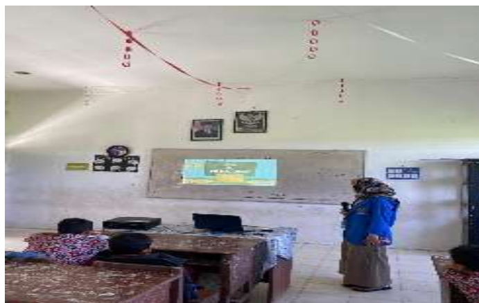
Gambar 2. Pemaparan materi pentingnya menabung.

Hasil dari kegiatan ini menunjukkan peningkatan pengetahuan dan kesadaran siswa SDN 106192 Desa Besar II Terjun mengenai pentingnya menabung sejak dini. Dengan menyisihkan uang jajan secara rutin, anak-anak bisa membeli barang yang mereka inginkan tanpa harus meminta uang tambahan dari orang tua. Mereka juga telah diajarkan tentang pentingnya uang dan bagaimana mengelolanya agar dapat ditabung. Dengan celengan yang mereka buat sendiri, mereka diharapkan semakin rajin menabung dan belajar berhemat. Selama kegiatan berlangsung, anak-anak sangat antusias mengikuti arahan dan melaksanakan tugas dengan penuh semangat. Hal ini karena sebagian dari mereka belum memiliki celengan dan kurang mendapat motivasi dari orang tua untuk menabung. Mereka juga merasa antusias karena belum pernah membuat celengan sendiri, terlebih bahan dan alat yang digunakan sangat mudah ditemukan di sekitar mereka. Tim pengabdian juga memberikan kebebasan kepada anak-anak untuk memilih kertas kado sesuai keinginan mereka. Berikut foto-foto hasil dokumentasi dari pelaksanaan kegiatan Sosialisasi Menabung Sejak Dini Dan Membuat Celengan Dari Barang Bekas dapat dilihat sebagai berikut: