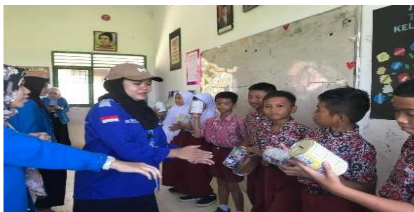
Gambar 3. Para Tim mendampingi anak-anak untuk mengolah barang bekas menjadi celengan.

produk perbankan yang ada. Mereka menekankan pentingnya disiplin dalam mengikuti rencana keuangan yang telah ditetapkan. Dengan melakukan ini, peserta diharapkan dapat merasakan manfaat langsung dari kebiasaan menabung yang diterapkan dalam kehidupan sehari-hari. Kegiatan ini diakhiri dengan sesi tanya jawab, di mana peserta dapat mengajukan pertanyaan seputar topik menabung dan pengelolaan keuangan. Ini merupakan kesempatan bagi mereka untuk mendalami pemahaman serta mendiskusikan tantangan yang mungkin dihadapi dalam praktik menabung. Secara keseluruhan, gambar ini mencerminkan komitmen tim untuk memberdayakan masyarakat melalui edukasi keuangan, sehingga mereka dapat membuat keputusan yang lebih bijak dalam mengelola keuangan pribadi.