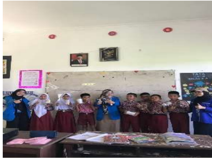
Gambar 4. Para tim memberikan kuis hadiah sederhana celengan yang terbuat dari pahan bekas.