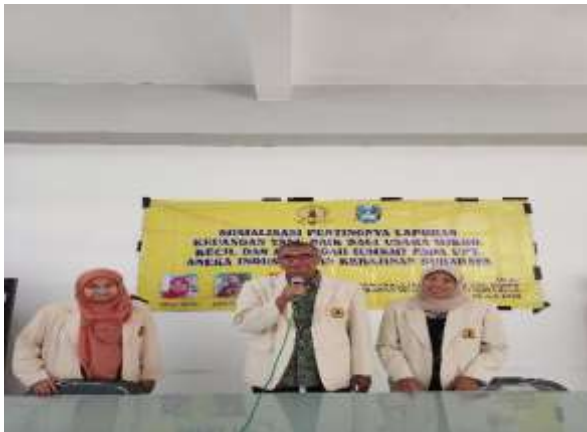
Gambar. 2 Tim Pengabdian Masyarakat

Sesi pertama dilakukan pengenalan tim pengabdian masyarakat dengan peserta pelaku UMKM.