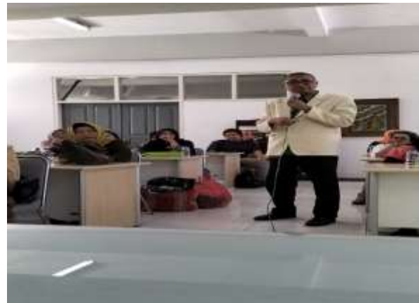
Gambar. 3 Pemaparan Materi

Setelah pemaparan materi berikutnya dibuka sesi tanya jawab ( Gambar 4) dimana para peserta dapat bertanya kepada tim pengabdian masyarakat tentang laporan keuangan. Dibuka juga kesempatan untuk berdiskusi bagi pelaku UMKM untuk mendiskusikan permasalahan yang berkaitan dengan penyusunan laporan keuangan sederhana. Dari sini akan terlihat pemahaman pelaku UMKM mengenai penting laporan keuangan yang baik. Sesi berikutnya adalah sesi penutupan. Pada sesi ini tim pengabdian dan seluruh peserta melakukan foto Bersama ( Gambar 5).