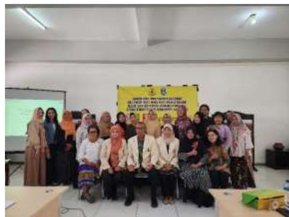
Gambar. 5 Foto Bersama Pemateri dan Peserta