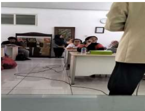
Gambar. 4 Sesi Tanya Jawab

Setelah pemaparan materi berikutnya dibuka sesi tanya jawab ( Gambar 4) dimana para peserta dapat bertanya kepada tim pengabdian masyarakat tentang laporan keuangan. Dibuka juga kesempatan untuk berdiskusi bagi pelaku UMKM untuk mendiskusikan permasalahan yang berkaitan dengan penyusunan laporan keuangan sederhana. Dari sini akan terlihat pemahaman pelaku UMKM mengenai penting laporan keuangan yang baik. Sesi berikutnya adalah sesi penutupan. Pada sesi ini tim pengabdian dan seluruh peserta melakukan foto Bersama ( Gambar 5).