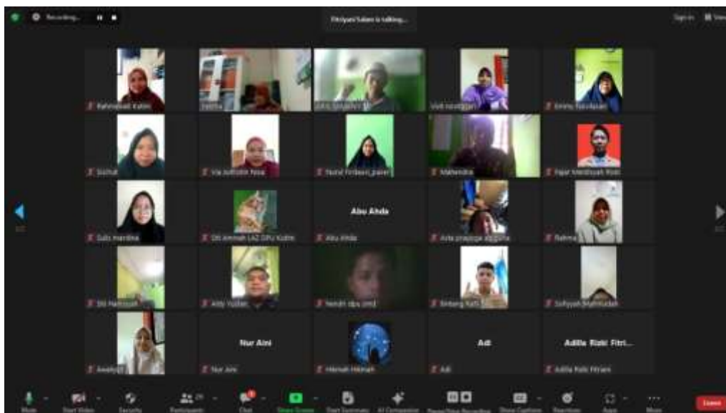
Gambar 1 : Penyampaian Materi Fiqh Zakat dan Simulasi Penghitungan Zakat

Foto Kegiatan Pelatihan Fiqh Zakat bagi Amil di LAZ Dana Peduli Umat seKalimantan Timur secara daring melalui aplikasi Zoom Meeting dapat dilihat pada gambar 1 dan 2 berikut :