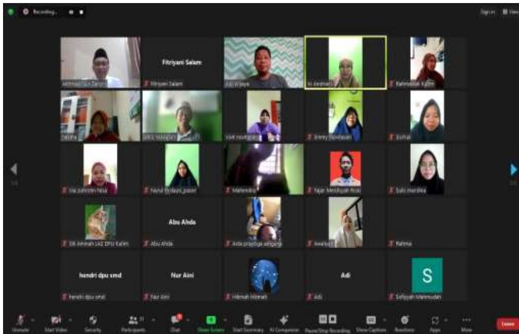
Gambar 2 : Diskusi dan tanya jawab