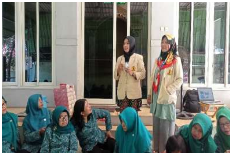
Gambar. 3 Praktik Pemanfaatan Barang Bekas/Barang Plastik (Sendok Plastik dan Botol Minuman Memasan) dari Tim Pengabdian

Sesi ketiga yaitu praktik memanfaatkan barang bekas dari tim pengabdian. Di sini tim pengabdian mencoba memanfaatkan barang bekas yaitu sendok makan dari plastik yang kemudian dipotong pegangannya dan kemudian ditempel dengan lem ke botol plastik bekas yang sudah dipotong separuh untuk dijadikan tempat pensil atau vas bunga dan lainnya. Untuk mempercantik tampilan dari barang bekas tersebut, tumpukan sendok plastik yang sudah dilem di botol plastik sebaiknya dicat terlebih dahulu sendoknya satu persatu dengan warna sesuai selera masing-masing.