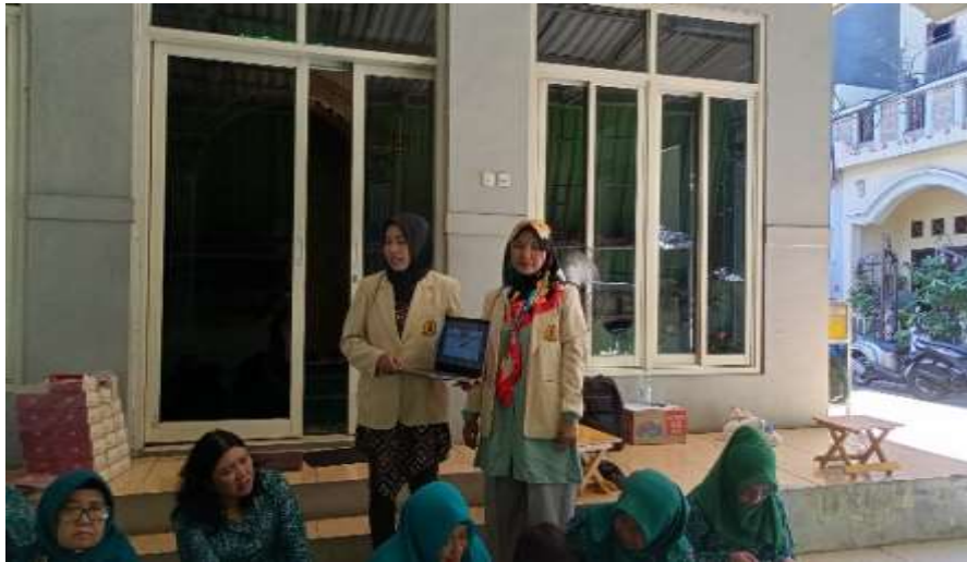
Gambar. 2 Penyampaian Materi Pengabdian Masyarakat dari Tim Pengabdian

Sesi ketiga yaitu praktik memanfaatkan barang bekas dari tim pengabdian. Di sini tim pengabdian mencoba memanfaatkan barang bekas yaitu sendok makan dari plastik yang kemudian dipotong pegangannya dan kemudian ditempel dengan lem ke botol plastik bekas yang sudah dipotong separuh untuk dijadikan tempat pensil atau vas bunga dan lainnya. Untuk mempercantik tampilan dari barang bekas tersebut, tumpukan sendok plastik yang sudah dilem di botol plastik sebaiknya dicat terlebih dahulu sendoknya satu persatu dengan warna sesuai selera masing-masing.