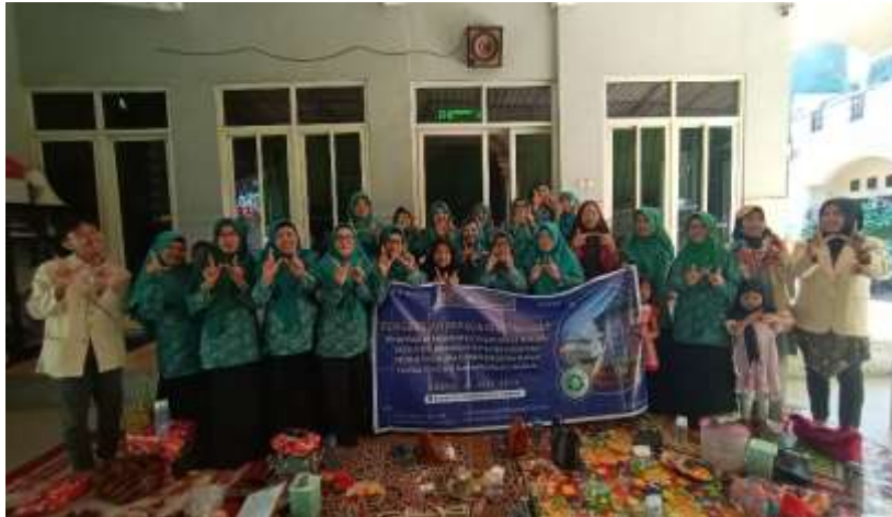
Gambar. 4 Acara Penutup (Sesi Foto Bersama Tim Pengabdi dan Ibu-Ibu PKK RW 06 Kecamatan Jambangan)

Pengabdian masyarakat yang telah dilakukan menunjukkan bahwa pelatihan tentang pengolahan sampah plastik atau pemanfaatan barang bekas menjadi produk kreatif telah meningkatkan kualitas sampah plastik yang terdapat di Kecamatan Jambangan menjadi produk mempunyai nilai jual/nilai ekonomis. Selain itu, peningkatan iptek serta keterampilan mitra dalam pengelolaan sampah plastik atau pemanfaatan barang bekas ini juga telah diterapkan dalam kegiatan ini.