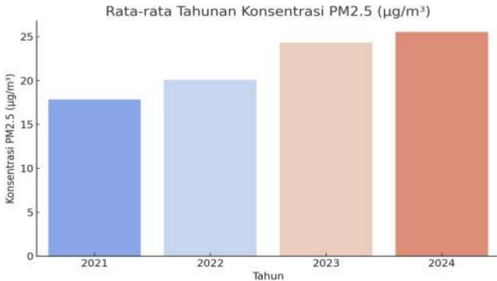
Gambar 3. Rata-rata Tahunan Konsentrasi PM 2.5 (µg/m 3 ) Tahun 2021–2024

Berdasarkan data pemantauan kualitas udara di kota Bengkulu selama periode September 2021 hingga Juli 2024, terlihat bahwa konsentrasi rata-rata bulanan PM 2.5 menunjukkan pola fluktuatif dengan kecenderungan meningkat pada musim kemarau, terutama pada bulan Mei hingga Agustus. Konsentrasi tertinggi tercatat pada bulan Agustus 2023 (32,50 µg/m 3 ) dan Juli 2024 (32,87 µg/m 3 ) yang diikuti oleh peningkatan nilai Indeks Standar Pencemaran Udara (ISPU) hingga kisaran 71-72. Meskipun dalam kategori Sedang menurut klasifikasi nasional.