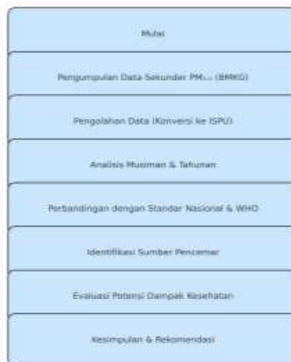
Gambar 1. Alur Proses Analisis Data PM 2.5 dan Evaluasi Dampak Kesehatan

Kategori ISPU ditentukan berdasarkan rentang nilai Baik (0-50), Sedang (51-100), Tidak Sehat (101-200), Sangat Tidak Sehat (201-300) dan Berbahaya (>300). tahapan analisis data terlihat seperti flowchart berikut: