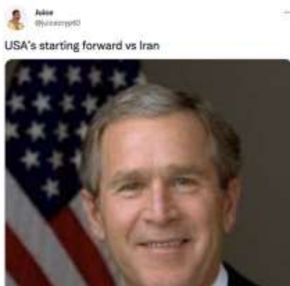
Gambar 7. Joe Biden

Meme tersebut diunggah oleh @juicecrypt0. Unsur tanda yang terlihat dalam gambar ini adalah gambar kepala laki-laki yang tersenyum dengan latar bendera Amerika Serikat. Selain gambar, sang kreator juga menambahkan kalimat yang menjelaskan gambar, yaitu "USA's starting forward vs Iran (penyerang awal USA vs Iran)".