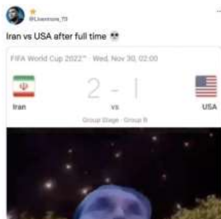
Gambar 6. Meme Suasana Pertandingan

Meme tersebut diunggah oleh @Livermore_79. Elemen tanda yang terlihat dalam gambar tersebut adalah gambar bendera Iran yang disejajarkan dengan bendera Amerika Serikat yang diletakkan di atas gambar separuh kepala orang dengan yang menghadap ke atas. Pengunggah juga menambahkan kalimat "Iran vs USA after full time (Iran vs USA setelah waktu penuh)". Meme disajikan dengan meletakkan kalimat di atas gambar bendera Iran di sebelah kiri dan bendera USA di sebelah kanan.