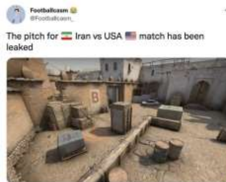
Gambar 5. Meme Permukiman Kosong

Meme tersebut diunggah oleh @Footballcasm. Elemen tanda yang terlihat dalam gambar tersebut adalah sebuah permukiman dengan beberapa bangunan terbengkalai. Selain gambar, pengunggah juga menambahkan kalimat "The pitch for Iran vs USA match has been leaked (tanda pertandingan Iran vs USA telah bocor)". Gambar bangunan disajikan dengan warna cokelat dan putih.