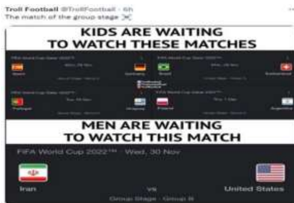
Gambar 3. Meme Pertandingan Amerika vs Iran

Meme tersebut diunggah oleh @TrollFootball . Elemen tanda yang terlihat dalam gambar tersebut adalah gambar alur pertandingan sepakbola dalam piala dunia di Qatar 2022. Gambar tersebut disajikan dengan membandingkan antara penilaian anak-anak dengan laki-laki dewasa terhadap piala dunia. Penyajian perbandingan tersebut diletakkan di atas dan bawah. Selain gambar, pengunggah juga menuliskan kalimat yang menggambarkan gambar. Pada sebelah atas " kids are waiting to watch these matches (anak-anak sedang menunggu untuk menonton pertandingan ini) ", sedangkan bagian bawah " men are waiting to watch this match (pria sedang menunggu untuk menonton pertandingan ini) ".