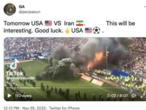
Gambar 2. Meme Peperangan di Lapangan Sepak Bola

Meme tersebut diunggah oleh @jeorjeaoun. Elemen tanda yang terlihat dalam gambar tersebut adalah gambar pembakaran sesuatu di lapangan sepak bola sehingga keluar asap hitam dalam kerumunan banyak penonton. Gambar dipilih kreator dari cuplikan video di tik-tok karena dirasa menggambarkan suasana pertandingan antara Amerika vs Iran. Selain gambar, pengunggah menuliskan kalimat yang menggambarkan gambar, yaitu “Tomorrow USA vs Iran. This will be interesting. Good luck. USA (Besok AS