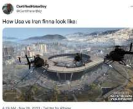
Gambar 8. Meme Stadion Terbangkalai

Meme tersebut diunggah oleh @CertiHaterBoy. Berdasarkan elemen tanda, meme tersebut menampilkan gambar stadion yang terlihat terbangkalai dengan latar perkotaan. Meme juga disajikan dengan dominasi warna biru. Selain gambar, pengunggah juga menambahkan kalimat yang merepresentasikan gambar, yaitu “How Usa vs Iran finna look like: ( Bagaimana tampilan akhir AS vs Iran: )”.