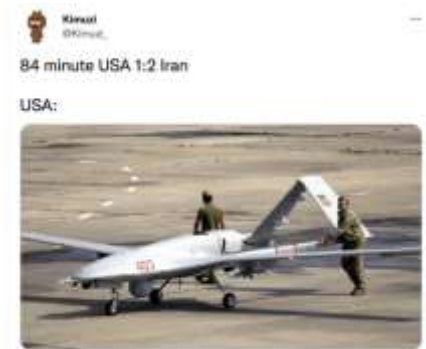
Gambar 4. Meme Persiapan Perang Dunia 3

Meme tersebut diunggah oleh @Kimuzi. Elemen tanda yang terlihat dalam gambar tersebut adalah gambar pesawat dan dua orang laki-laki di sebuah landasan pacu. Selain gambar, pengunggah juga menuliskan kalimat memvisualisasikan gambar. Kalimatnya, yaitu "84 minute USA 1:2 Iran (84 menit USA 1:2 Iran)". Kemudian, kalimat bawahnya bertuliskan "USA" yang diberikan gambar.