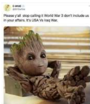
Gambar 10. Meme Menolak Perang

Meme pada gambar yang diunggah oleh @St1Ewhite. Unsur tanda yang terlihat pada gambar tiga adalah gambar patung anak kecil yang sedang berbaring pada sebuah batu dengan santai. Penulis juga menambahkan kata-kata untuk menjelaskan maksud gambar. Kalimat yang ditulis, yaitu "Please y'all stop calling it World War 3 don't include us in your affairs. It's USA Vs Iraq War (Tolong kalian berhenti menyebutnya perang dunia 3 jangan sertakan kami dalam urusan kalian. Ini perang AS vs Irak)" .