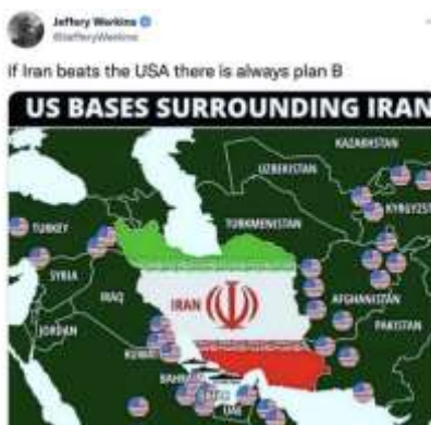
Gambar 9. Meme peta persebaran wilayah

Meme tersebut diunggah oleh akun @JefferyWerkins. Berdasarkan elemen tanda Pierce, meme tersebut menggunakan latar hijau dan peta persebaran wilayah Iran dan Amerika Serikat. Peta persebaran wilayah Iran diletakkan memusat di tengah dengan warna bendera negara tersebut. Kemudian, gambar wilayah Amerika Serikat menyebar di sekitar wilayah Iran. Pengunggah juga menambahkan kalimat di dalam gambar, yaitu “US Bases Surrounding Iran ( kami pangkalan di sekitar Iran )”. Selain itu, ditambahkan pula kalimat di atas gambar, yaitu “If Iran beats the USA there is always plan B ( jika Iran