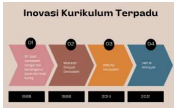
Gambar 1. transformasi kurikulum terpadu

Berdasarkan data wawancara di atas bahwa keberagaman materi pembelajaran di pesantren, yang mencakup ilmu agama serta ilmu pengetahuan umum dan keterampilan praktis, secara signifikan meningkatkan motivasi santri untuk belajar. Kombinasi ini tidak hanya memenuhi minat santri, tetapi juga memperluas pemahaman mereka tentang dunia di sekitar, sehingga memberikan bekal yang lebih komprehensif untuk menghadapi tantangan di masa depan.