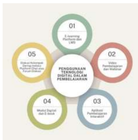
Gambar 2. Penggunaan Teknologi Digital dalam Pembelajaran

Berdasarkan wawancara di atas, dapat ditarik benang merah bahwa , e-learning memberikan kesempatan bagi santri untuk belajar secara mandiri dengan fleksibilitas memilih materi sesuai kebutuhan, serta kemudahan mengakses ulang materi yang telah direkam. Platform ini tidak hanya mendukung pembelajaran jarak jauh tetapi juga memungkinkan santri untuk mendalami topik yang diminati melalui beragam sumber tambahan, seperti artikel, video, dan modul daring, yang memperkaya pengalaman belajar mereka.