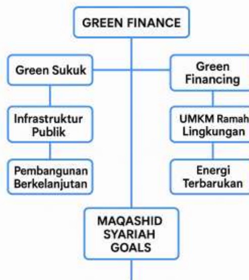
Gambar 2. Diagram Jaringan Konsep Green finance dalam Perspektif Ekonomi Syariah

pengembangan produk-produk keuangan hijau sesuai prinsip syariah (Khomsatun et al., 2023; Alfarizi et al., 2023). Hambatan ini menyebabkan potensi besar green finance belum sepenuhnya dimanfaatkan untuk mempercepat transisi menuju ekonomi hijau dan berkelanjutan. Oleh karena itu, diperlukan kolaborasi antara pemerintah, lembaga keuangan, dan masyarakat untuk memperkuat ekosistem green finance syariah. Penjelasan lebih lanjutnya, kolaborasi ini dapat diwujudkan melalui peningkatan edukasi publik agar masyarakat lebih memahami pentingnya investasi hijau, penyusunan regulasi yang lebih adaptif dan berpihak pada pengembangan instrumen keuangan syariah yang ramah lingkungan, serta mendorong inovasi produk keuangan yang mampu menjawab kebutuhan pendanaan proyek-proyek berkelanjutan. Langkah-langkah tersebut diharapkan dapat memperkuat peran green finance sebagai pilar penting dalam mendukung pencapaian tujuan pembangunan berkelanjutan yang sejalan dengan prinsip maqashid syariah.