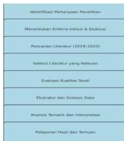
Gambar 2: gambar alur proses SLR