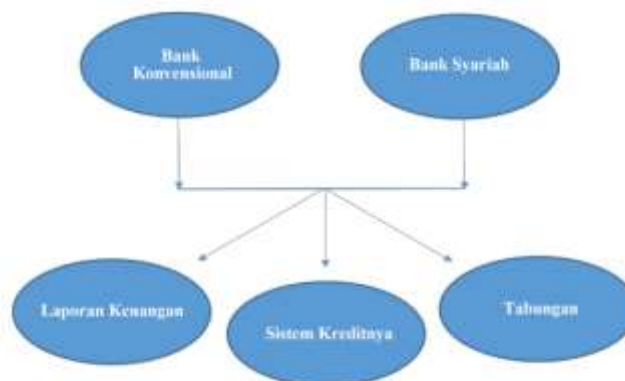
Gambar 2. Kerangka Berpikir Variabel Bank

Analisis literatur ini bertujuan untuk memberikan pemahaman yang lebih komprehensif mengenai perbandingan kinerja antara bank syariah dan bank konvensional, baik dalam aspek keuangan maupun dalam hal pencapaian nilai-nilai dan prinsip-prinsip syariah (Suzana et al., 2025). Melalui sintesis konteks yang relevan, tinjauan pustaka komprehensif, data observasi sebelumnya, serta analisis komparatif variabel antara bank konvensional dan syariah, kerangka konseptual untuk analisis ini telah disusun, yaitu: