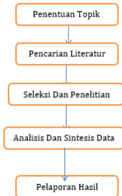
Gambar 2. Tahapan penelitian

Gambar 1 Menunjukkan diagram alur pada penelitian ini, dimana penelitian ini dimulai dengan penentuan topik yaitu dampak fatwa dsn-mui terhadap sistem keuangan syaria'ah di indonesia. Setelah menemukan topik yang ingin dibahas, maka dilanjutkan dengan pencarian literatur terhadap beberapa jurnal yang relevan dengan topik yang dipilih. Kemudian dilanjutkan dengan seleksi dan penilaian jurnal, guna menemukan jurnal terbaik yang digunakan dalam mendukung penelitian ini. Selanjutnya penulis melakukan analisis dan sintesis data dari jurnal yang telah diseleksi untuk mendapatkan jawaban berupa metode terbaik. Tahapan terakhir dalam penelitian ini yaitu penyusunan pelaporan akhir dari penelitian yang telah dilakukan.