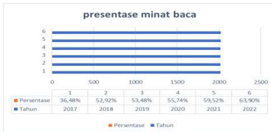
Gambar 1.1 Presentase minat baca di Indonesia

baca dikalangan masyarakat, kurangnya kesadaran akan pentingnya literasi, terutama pada anak-anak, dan kualitas pendidikan yang bervariasi diberbagai wilayah. Selain itu, tantangan lainnya termasuk kurangnya peran orang tua dalam membantu meningkatkan minat baca anak-anak, serta kurangnya dukungan dan invetasi dalam pengembangan program-program literasi yang efektif dan menarik sehingga mampu meningkatkan minat baca. Perkembangan minat baca pada anak usia dini adalah hal yang perlu diperhatikan selama masa proses bertumbuh dan berkembang.