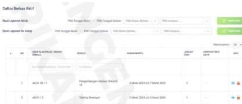
Gambar 3. Pemberkasan Arsip