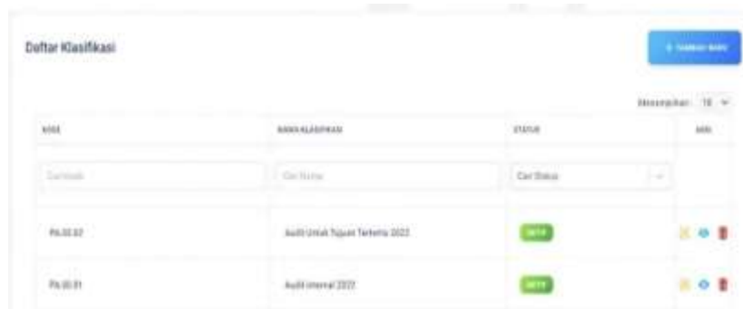
Gambar 2. Instrumen Kearsipan