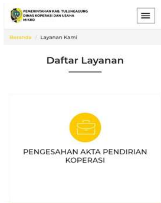
Gambar 3. ( https://dinkopum.tulungagung.go.id/ , n.d.)

tiket. Setiap pemohon akan mendapatkan nomor tiket yang unik dimana dapat di gunakan untuk melacak progres dan respon secara langsung.