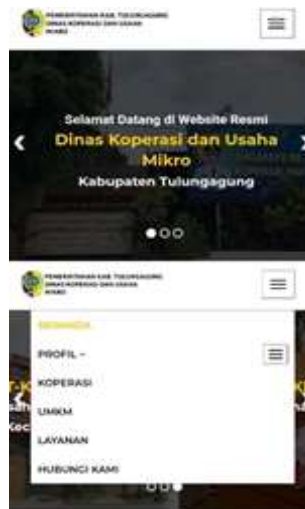
Gambar 1. Tampilan awal dari website ( https://dinkopum.tulungagung.go.id )

Dapat ditarik kesimpulan aspek informasi masih belum berjalan dengan baik, dimana dalam website https://www.dinkopum.tulungagung.go.id hanya mencantumkan seputar daftar para UMKM dan juga koperasi yang ada di Kabupaten Tulungagung serta beberapa daftar layanan yang disediakan.