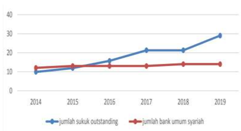
Gambar 2. Laju Pertumbuhan sukuk outstanding dan bank umum Syariah di Indonesia Tahun 2014-2019

PDB. Menurut Islamic Financial Services Board (IFSB) (2015), pasar modal Syariah dan pembiayaan perbankan Syariah dapat berperan sebagai pembiayaan dalam sektor riil ini. Pasar ekuitas syariah terdiri dari tiga bagian utama saham syariah, sukuk, dan reksadana syariah. Studi (2022) menemukan bahwa sukuk, reksadana syariah, dan saham syariah memiliki korelasi yang signifikan dengan pertumbuhan ekonomi Indonesia dalam jangka panjang. Laporan statistik yang dirilis oleh Otoritas Jasa Keuangan (OJK) menunjukkan bahwa instrumen pasar modal syariah seperti saham syariah, obligasi syariah (sukuk), dan reksadana syariah mengalami kemajuan yang positif. Selain itu, data yang dirilis oleh OJK juga menunjukkan bahwa pertumbuhan bank umum syariah dari tahun 2014 hingga 2019 juga menunjukkan peningkatan yang positif setiap tahunnya.