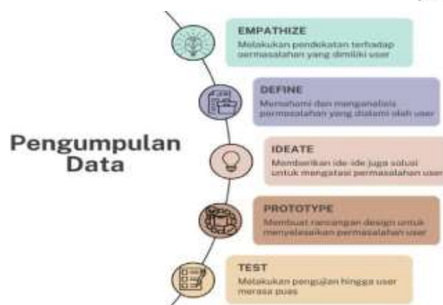
Gambar 1. Tahapan Proses Design Thinking