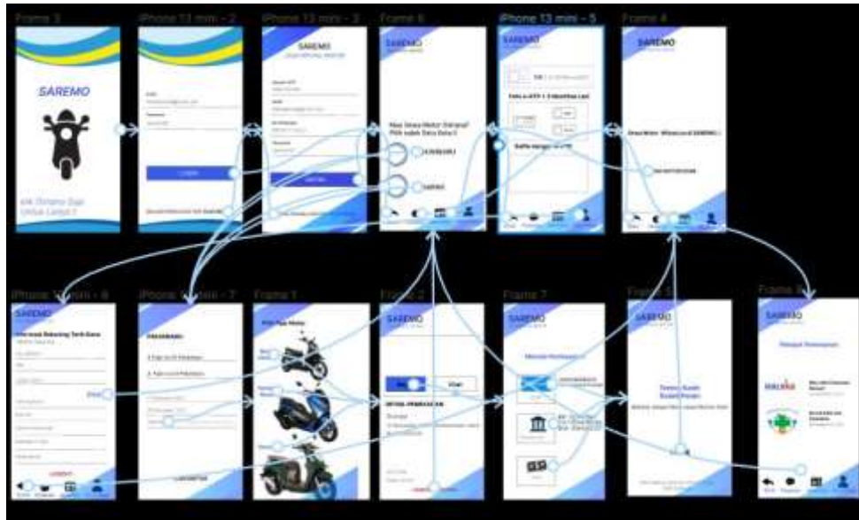
Gambar 5. High-Fidelity Wireframe