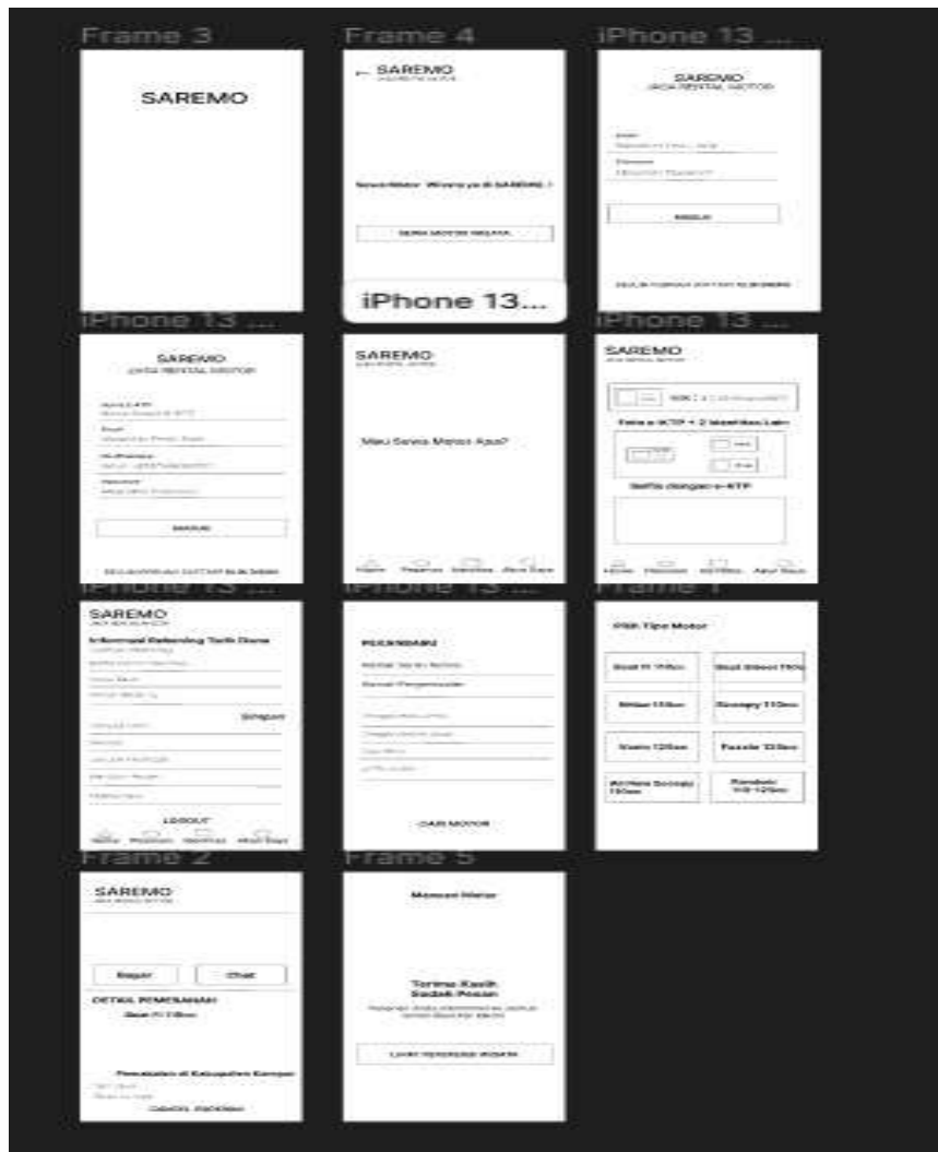
Gambar 4. Low-Fidelity Wireframe