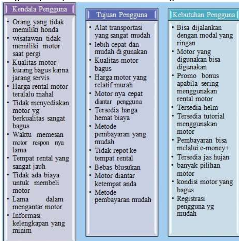
Gambar 2. Affnity Map

Tahapan Empathize ini melakukan sebuah observasi dan wawancara baik secara langsung maupun tidak langsung. Observasi dilakukan dengan cara mempelajari proses bisnis sebagai bahan referensi fitur-fitur yang akan digunakan dan dibutuhkan pada aplikasi. Selanjutnya dilakukan pembuatan affinity map atau affinity diagram. Affinity map atau affinity diagram merupakan teknik yang digunakan dalam melakukan proses user research untuk mendapatkan berbagai macam wawasan dan juga peluang yang muncul. Hasil dari proses Affinity Diagram pada penelitian ini adalah sebagai berikut: