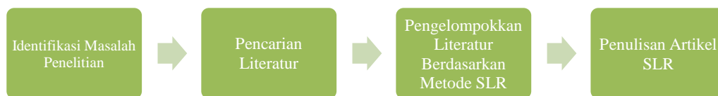
Gambar 1. Alur Bagan Penelitian