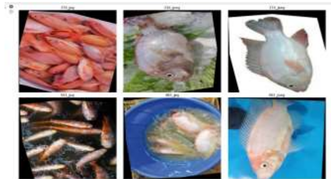
Gambar 3. Beberapa Dataset yang Berhasil Dimuat

Bagian ini mengulas analisis penelitian serta temuan-temuan terbaru. Hasil dari percobaan atau eksperimen dan analisis yang dilakukan dievaluasi untuk menentukan kesesuaiannya. Pembahasan hasil tersebut didasarkan pada referensi yang digunakan.