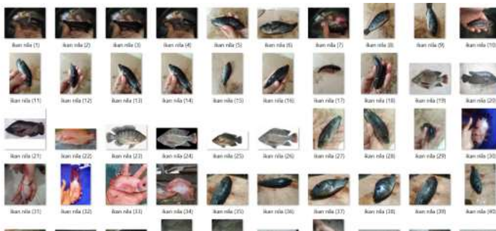
Gambar 2. Dataset

Pada penelitian ini, studi literatur dilakukan sebagai metode pengumpulan data untuk menemukan teori-teori yang telah dikembangkan dalam bidang pembuatan sistem. Ini termasuk membaca buku-buku yang berkaitan dengan topik penelitian dan mengeksplorasi internet, termasuk mengunjungi situs web yang terkait dengan topik penelitian dan mencari jurnal-jurnal yang relevan. Selain itu, gambar ikan nila segar dan tidak segar akan dikumpulkan dari berbagai sumber. Untuk mengambil gambar ikan nila dalam berbagai kondisi kesegaran, kamera digital dengan resolusi tinggi akan digunakan dan gambar tersebut akan disimpan dalam format file seperti JPEG atau PNG (Setijaningsih & Suryaningrum, 2015)