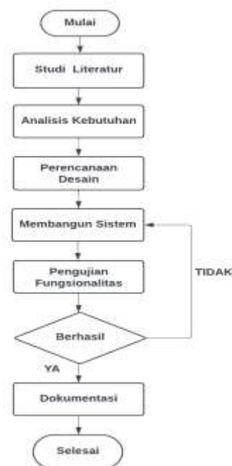
Gambar 4 Alur Penelitian

Dengan pendekatan ini, pengembangan prototype memungkinkan peneliti untuk menguji konsep baru, mengidentifikasi masalah potensial, dan menghasilkan solusi yang dalam pengembangan sistem monitoring pemberian nutrisi otomatis yang lebih baik dan terintegrasi bagi tanaman bunga Aglaonema.