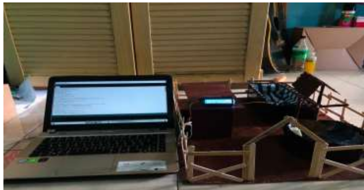
Gambar 2 Desain Prototype

Dengan mempertimbangkan hasil identifikasi kebutuhan, merancang prototype sistem monitoring pemberian nutrisi otomatis pada tanaman bunga Aglaonema berbasis Internet of Things (IoT). Tujuan utamanya adalah untuk menggambarkan secara kasar bagaimana interaksi antara sensor nutrisi tanah, mikrokontroler, sistem penyemprot nutrisi, dan komponen lainnya akan terjadi.