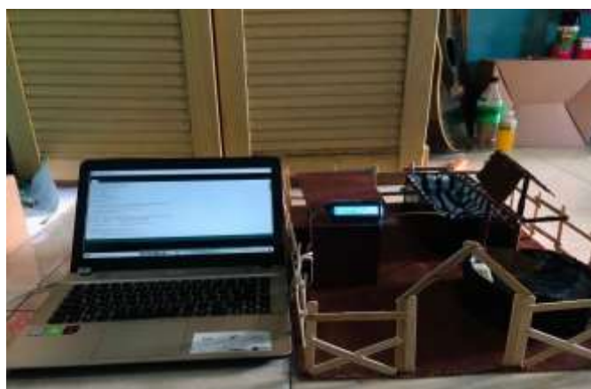
Gambar 5 Bentuk Prototype

Pada skripsi ini, telah dikembangkan dan di uji dengan purwarupa sistem monitoring pemberian nutrisi pada tanaman aglaonemaberbasis Internet Of Thing(IoT). Yang melakukan pemebrian nutrisi serta penyiraman secara otomatis dan juga tepat waktu dan jika kelembaban kurang dari 700 seperti yang di tentukan maka otomatis melakukan pemberian nutrisi sekaligus dengan penyiraman, jadi tidak terpaku dari jadwal yang sudah ditentukan. Untuk proses pembuatan sistem monitoring pemberian nutrisi pada bunga aglaonema berbasis Internet of Thing(IoT). Dalam tahapan prototype, setelah melakukan rancangan perangkat sensor keras Internet Of Thing(IoT) dan juga pemrograman software atau perangkat lunak pada Arduino IDE dan aplikasi Blynk. Tahap selanjutnya yaitu pengujian,hasil dari pengujian tersebut kemudian akan didata dan akan digunakan sebagai kesimpulan.[13]