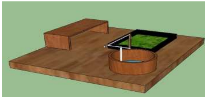
Gambar 3 Pengembangan Purwarupa