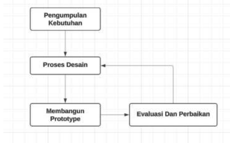
Gambar 1 Metode penelitian prototype

Metode yang digunakan dalam penelitian ini adalah pendekatan pengembangan (development research), berfokus pada pembuatan prototipe sistem monitoring pemberian nutrisi otomatis pada tanaman hias. Penelitian ini bertujuan menghasilkan produk atau sistem baru yang memanfaatkan teknologi Internet of Things (IoT) dengan sensor soil moisture sebagai alat untuk mendeteksi kelembaban tanah dan nozzle sprayer untuk penyiraman otomatis. Komponen utama sistem ini terdiri dari mikrokontroler ESP32, sensor kelembaban tanah, sensor nutrisi, RTC (Real-Time Clock), pompa, relay, dan aplikasi Blynk untuk monitoring dan kontrol jarak jauh. [10].