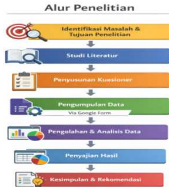
Tabel 1 Hasil pengumpulan data dari kuesioner Via Google Form: