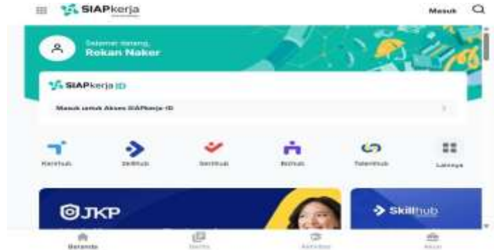
Gambar 1. Tampilan Website SiapKerja

kegunaan atau usability website, salah satunya dengan menerapkan metode System Usability Scale (SUS) . Tujuan dari Penelitian ini adalah mengetahui sejauh mana kualitas penggunaan sistem dalam platform online tersebut. Pada gambar 1 merupakan tampilan website SiapKerja yang sedang diujikan.