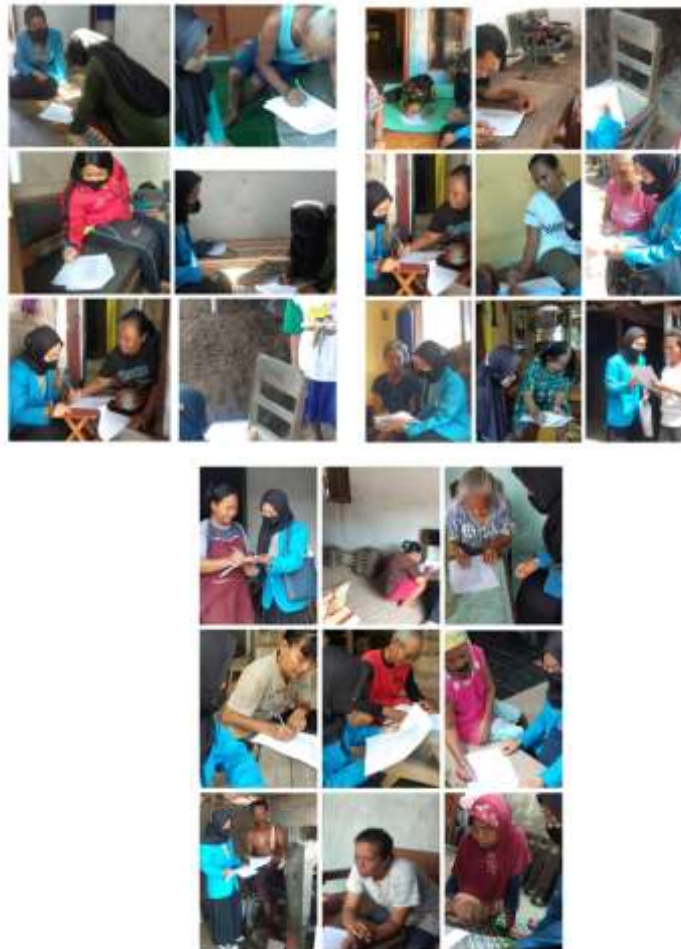
Gambar 1. Pengambilan Data Tatap Muka Melalui Keusioner

Jenis data kualitatif yang diperoleh dari reponden baik lisan maupun tulisan, sedangkan angka statistik sebagai data kuantitatif. Uji validitas reliabilitas digunakan untuk uji coba instrumen. Sedangkan sumber data primer diperoleh melalui instrumen dalam bentuk kuesioner tertutup yang dibagikan langsung secara tatap muka yang tercantum pada Gambar 1. berikut: