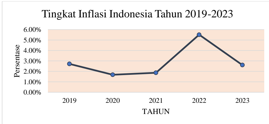
Gambar 1. Tingkat Inflasi Indonesia 2019-2023 Sumber: Badan Pusat Statistik (BPS)