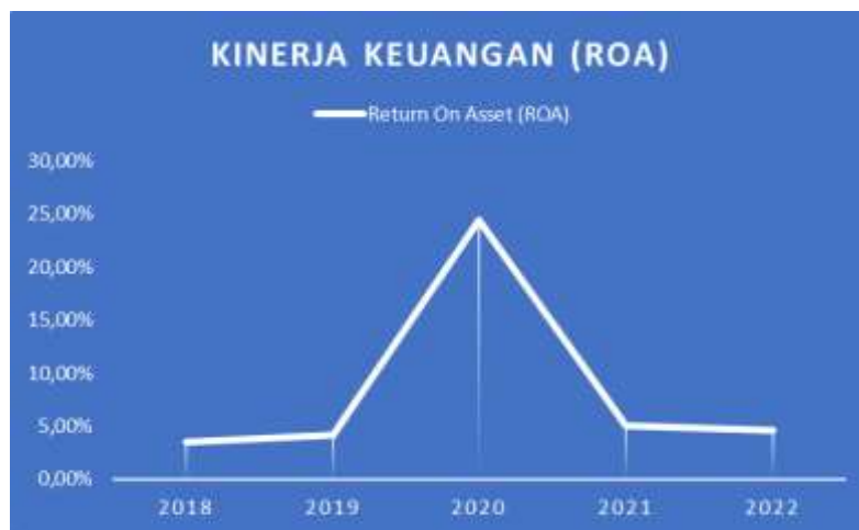
Gambar 1. Kinerja Keuangan

Pada tahun 2020, kinerja keuangan perusahaan manufaktur sub sektor makanan dan minuman di Bursa Efek Indonesia menunjukkan peningkatan signifikan sebesar 24%. Kenaikan ini cukup mencolok dibandingkan dengan tahun-tahun sebelumnya, di mana pada tahun 2018 dan 2019 hanya mencatatkan kenaikan sebesar 4%. Namun, perubahan drastis terjadi pada tahun 2021 dan 2022, di mana kinerja keuangan mengalami penurunan tajam menjadi hanya 5%, turun dari 19% pada tahun sebelumnya.