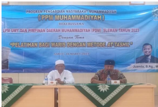
Sambutan PDM Sleman