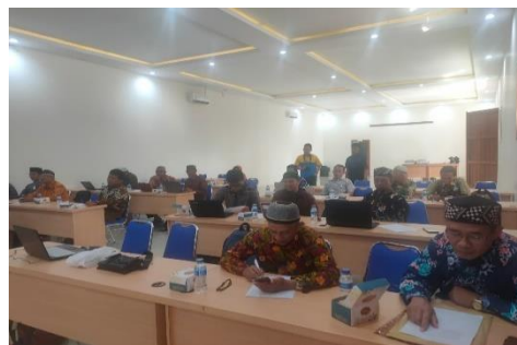
Gambar 2. Praktek Hitung Waris