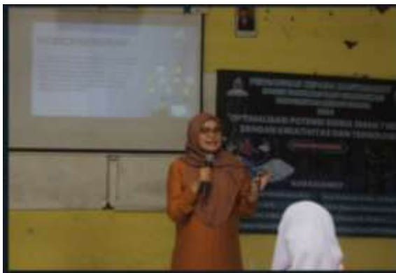
Gambar 1. Pemaparan materi