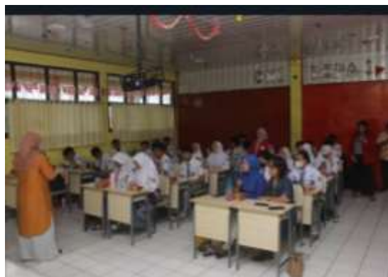
Gambar 2. Tanya Jawab antara pematiri dan Siswa

Berikut materi yang diberikan kepada peserta: